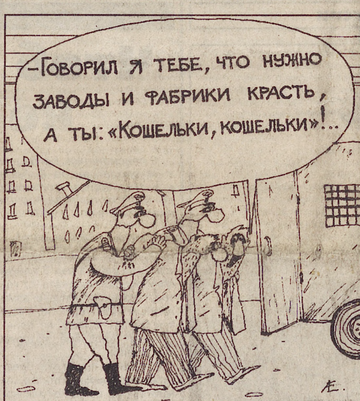
Рисунок Алексея ЕВТУШЕНКО.