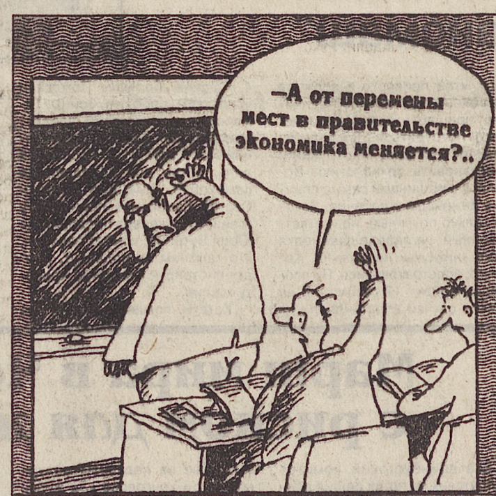
Рисунок Вячеслава ШИЛОВА.

«Урал» поначалу арендует производственные площади. А потом строит свои цехи и сводит к минимуму зависимость от арендодателя. Погрешивши какое-то время от чужой и к тому же ненадежной котельной, начинает строить свою, понимая, что это — убытки в течение нескольких лет, но независимость в перспективе. Встает перед угрозой распада