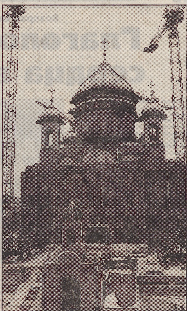
Слова этой женщины оказались пророческими. Собор, чья трагическая судьба сродни судьбе России, возрождается. И пока жива людская память о русских воинах, положивших жизнь на алтарь Отечества, будет вытесана над Москвой храм Христа Спасителя.

Интересна судьба последней. Когда храм снесли, ее случайно среди руин нашла одна из прихожанок и принесла домой. Через много лет, умирая, женщина завещала дочери вернуть икону святыне, если та когда-нибудь будет восстановлена.