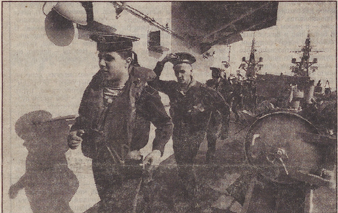
Боевая тревога на сторожевом корабле.