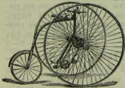
THE SANDRINGHAM CLUB

всѣхъ системъ и принадлежности къ нимъ-же.