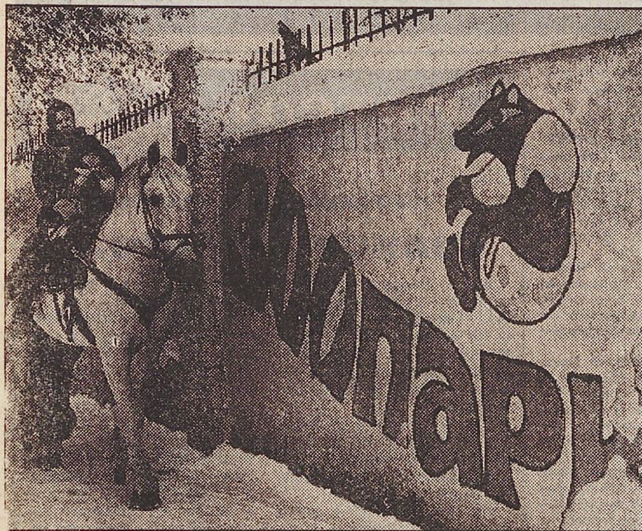
Репортаж из зоопарка