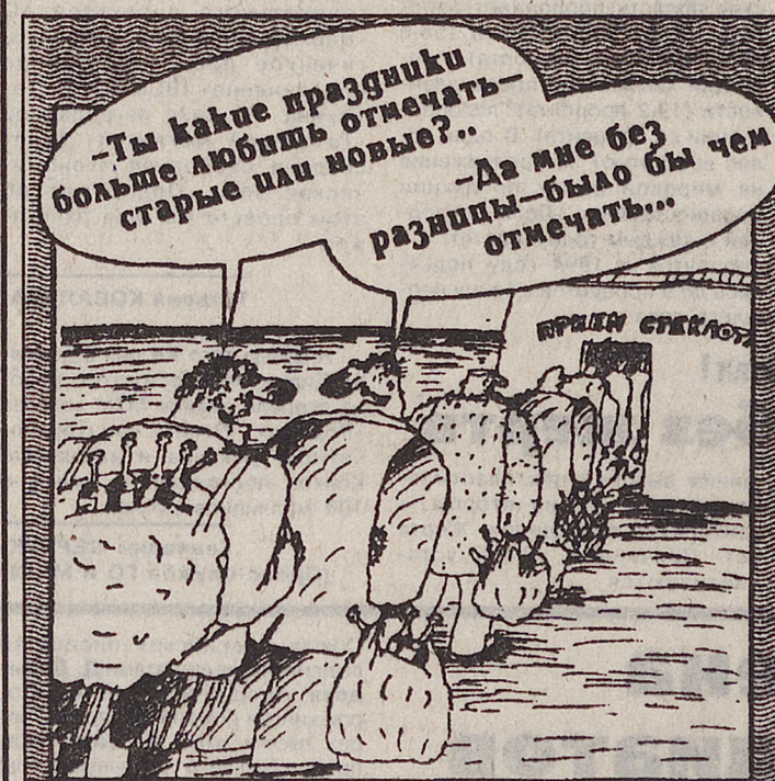
Рисунок Вячеслава ШИЛОВА.