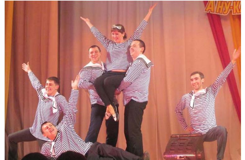
2015 год. Команда заводоуправления «Залп».

«А ну-ка, парни!» - верная примета мужского праздника. В разные годы на сцене заводского Дворца культуры соревновались команды цехов, школьники, студенты, военнослужащие и сотрудники МЧС.