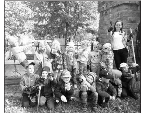
Команда Каменского детского сада