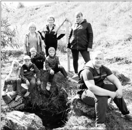
Активисты из Маминского детского сада