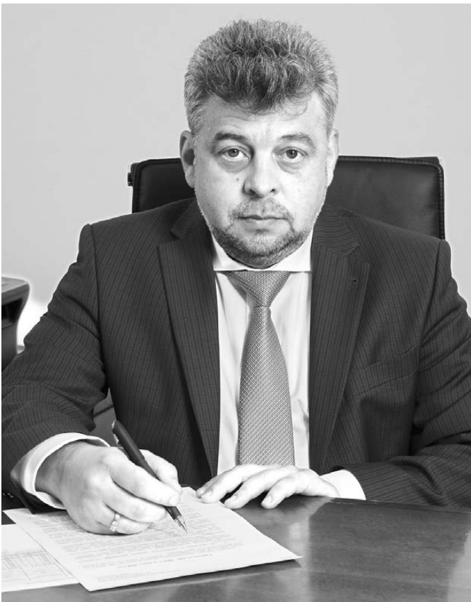
УПРАВЛЕНИЕ РОСРЕЕСТРА ПО СВЕРДЛОВСКОЙ ОБЛАСТИ

Вишенка на торте — внесение административных границ в ЕГРН. Свердловская область граничит с семью субъектами