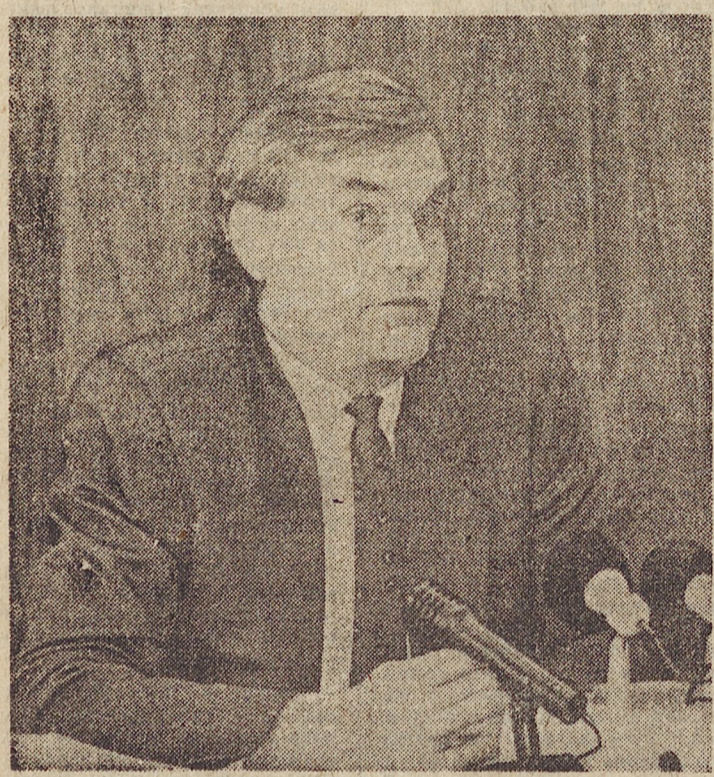
Сообщает пресс-служба председателя областной Думы Э. Россель

На вопросы корреспондента «ОГ» отвечает заместитель председателя областной Думы, бывший народный депутат России, участник исторического первого съезда российских депутатов, принявшего четыре года назад декларацию о суверенитете нашей республики