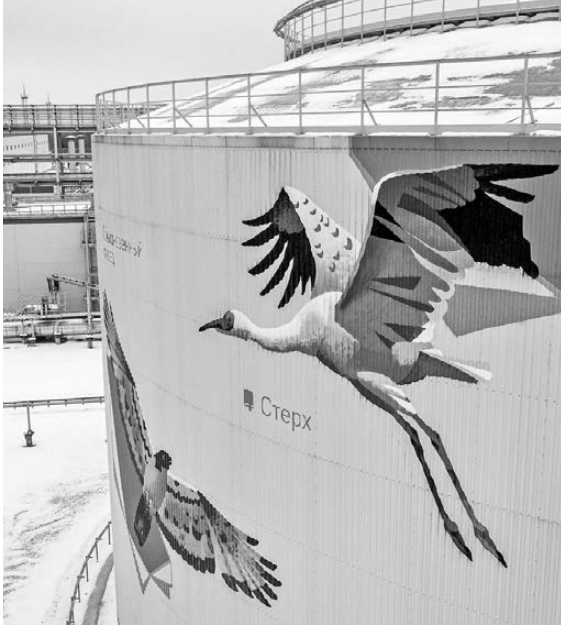
На резервуарах для технической и пожарной воды изображены 96 представителей животного и растительного мира региона, включая краснокнижных.

В Тюменской области не только активно занимаются лесовосстановлением, но и увеличивают количество особо охраняемых природных территорий. Сейчас их 99, к концу 2025-го, по планам властей региона, должно быть уже 123. Сотая по счету скоро появится в Армызонском районе, где формируют заповедник на путях миграции, местах гнездования водоплавающих и околоводных краснокнижных птиц — розового и кулярового пеликана, стерха, краснозобой казарки, турпана, лебедя-шугуна. Создание заповедника горячо приветствуют сотрудники кафедры зоологии и эволюционной экологии животных Тюменского государственного университета, предупреждая о сокращении ареала безопасного обитания ряда представителей фауны, заметно поредевшей за последние полвека. Ученые исследовали лесостепные зоны на юге области, прилегающих к ней районов Южного Урала, Зауралья, Казахстана и предложили участки, где негативное воздействие от хозяйственной деятельности человека пока еще не ощущается, тоже перевести в категорию охраняемых. ●