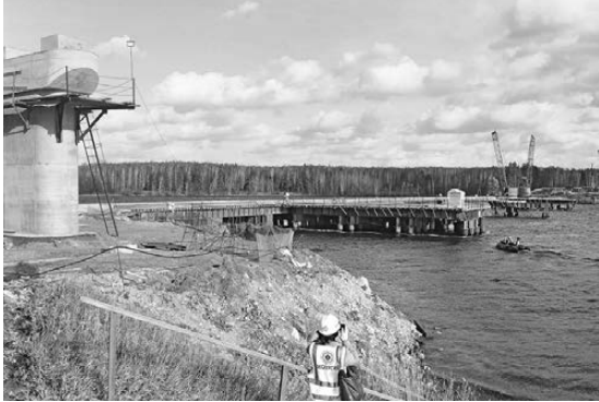
О том, что мост через пруд наконец свяжет две части промышленного города, тагильчане мечтали не одно десятилетие.

Не остаются без внимания градообразующих предприятий и учреждения образования и культуры: комбинаты шефствуют над школами и детскими садами, поддерживают Качканарский горно-промышленный и Нижнетагильский горно-металлургический колледжи. Нижнетагильский технологический институт — филиал УрФУ. Кроме того, ЕВРАЗ содержит Дворец культуры Нижнего Тагила и детские оздоровительные лагеря, санаторий-профилакторий «Леневка», реализует масштабные социальные программы для работников предприятий, оказывает помощь ветеранам и молодежи. Всего в дивизионе «Ураль» действует около двух десятков социальных программ, а на реализацию проектов жителей двух городов в рамках конкурса «ЕВРАЗ: город друзей — город идей!» компания выделяет около 6,5 миллиона рублей в год. ●