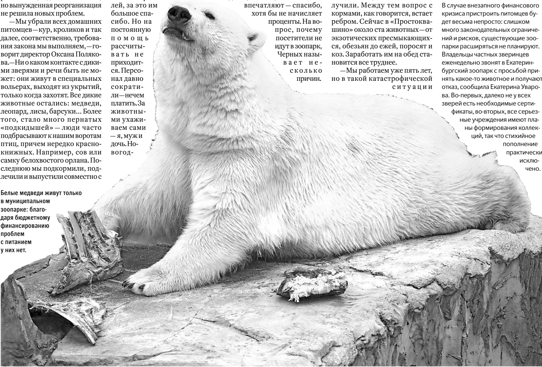
Белые медведи живут только в муниципальном зоопарке: благодаря бюджетному финансированию проблем с питанием у них нет.