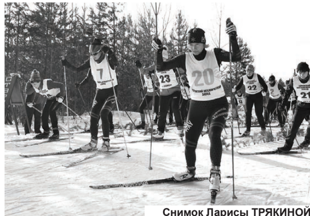
Снимок Ларисы ТРЯКИНОЙ