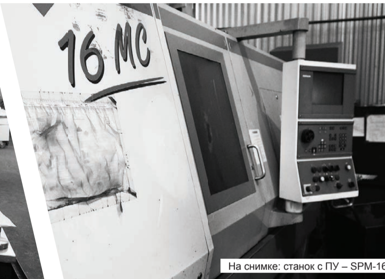
На снимке: станок с ПУ — SPM-16

Серовский механический завод в последние годы масштабно обновил свои производственные мощности, благодаря участию в федеральной целевой программе по развитию оборонно-промышленного комплекса. На текущий момент действие программы завершено. Проводится формирование новой государственной программы, наше предприятие готовит материалы для участия в ней. Однако и сейчас на заводе продолжается обновление основных фондов уже за счет своих резервов.