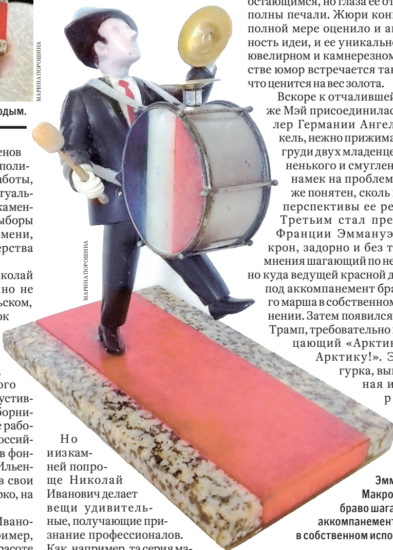
Эммануэль Макрон браво шагает под аккомпанемент марша в собственном исполнении.

Вскоре к отчалившей госпоже Мэй присоединилась канцлер Германии Ангела Меркель, нежно прижимающая к груди двух младенцев—черненького и смугленького... намек на проблему столь же понятен, сколь не ясны перспективы ее решения. Третьим стал президент Франции Эммануэль Макрон, задорно и без тени сомнения шагающий по неизвестно куда ведущей красной дорожке под аккомпанемент бравурного марша в собственном исполнении. Затем появился мистер Трамп, требовательно восклицаящий «Арктику мне, Арктику!». Эта фигурка, выполненная из дольчатых яшмы,