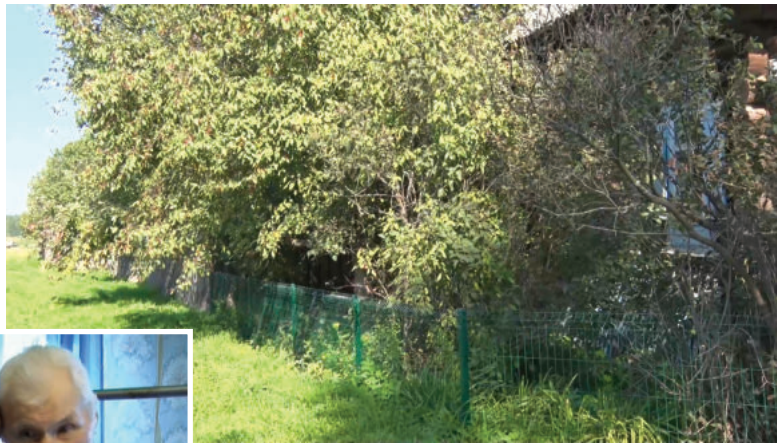
Мечта Федора Николаевича ВАНДЫШЕВА сбылась.

Радует то, что всё больше людей узнают об этом большом социальном благотворительном проекте и практически все поступающие мечты реализуются в очень короткое время. И под фотографиями появляется надпись: «Выполнено!»