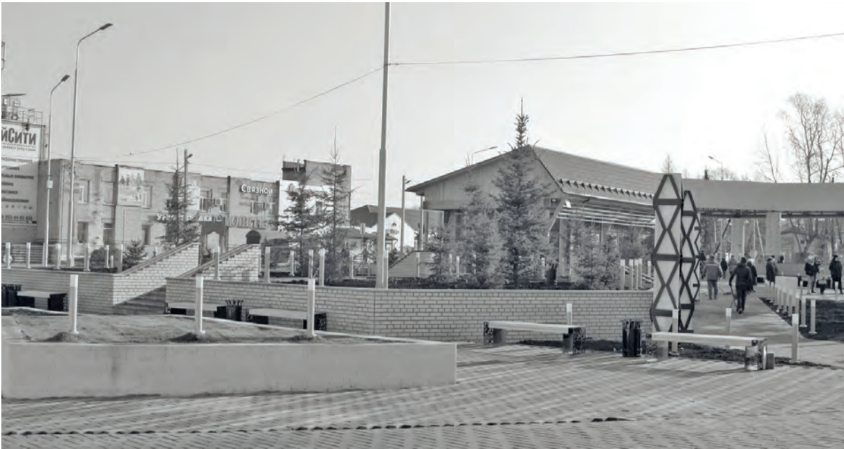
● Сквер «Город мастеров»