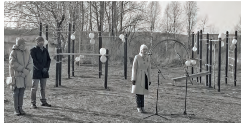
● В Киргишанах появилась новая спортивная площадка