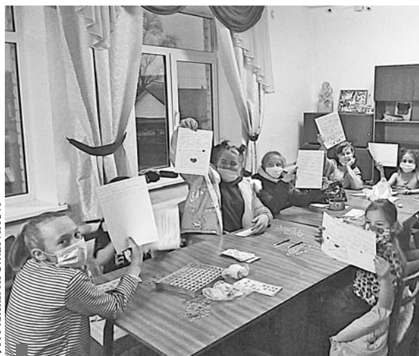
Письма с пожеланиями написаны

В конце октября отмечается один из самых душевных праздников – День бабушек и дедушек, которых детство не может считаться полным и ярким. А начало октября ознаменовано Всемирным днем почты.