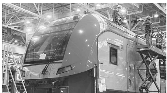
Техдокументация будет передана уральскому заводу компании «Сименс», локализация производства достигнет 80 процентов.

Началось строительство единственного в России производственного комплекса для выпуска электропоездов, скорость которых будет достигать 360 километров в час. Соглашение о намерениях заключили РЖД, группа «Синара», «Сименс Мобилити» и завод «Уральские локомотивы». Речь идет об изготовлении и обслуживании на протяжении жизненного цикла 42 электропоездов.