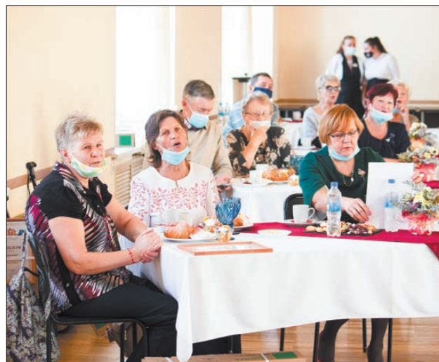
☎ Фото предоставлено приёмной депутата Вячеслава Брозовского

В Минтруде в свою очередь напомнили, что способ получения выплат пенсионеры также выбирают сами – через доставку «Почтой России» или через банк. При этом ведомство рекомендовало пенсионерам завести банковскую карту и ежемесячно получать на нее деньги, тогда они не будут зависеть от сроков доставки пенсии, пишет «Газета.ру».