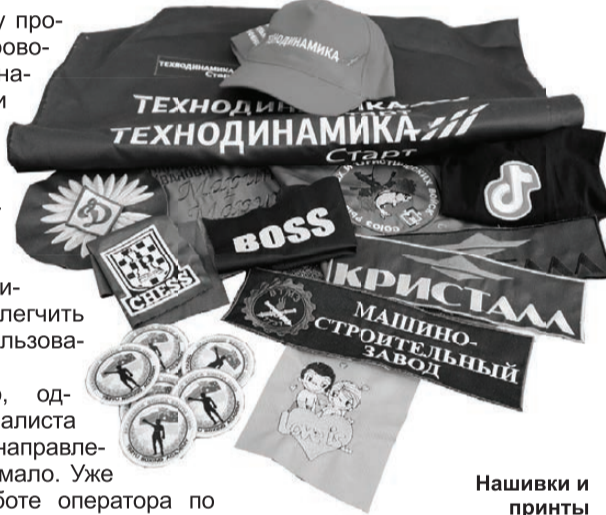
Нашивки и принты на готовые изделия