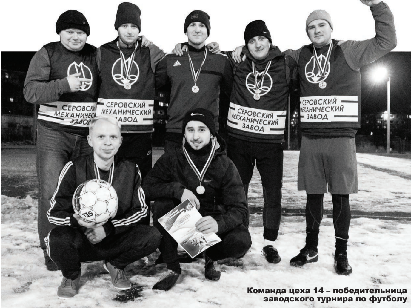
Команда цеха 14 – победительница заводского турнира по футболу

О Всемирном дне мужчин знают немногие. Да-да, оказывается, День защитника Отечества – не единственный праздник сильной половины. Всемирный день мужчин был учрежден в СССР Президентом М.С.Горбачевым, отмечается он в первую субботу ноября. А 19 ноября дамы могут отметить в календаре как Международный мужской день, дабы не забыть поздравить мужчин. Празднуется он аж в 60 странах мира, в том числе и в России.