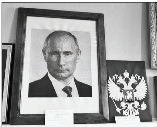
Портрет президента Российской Федерации В.В.Путина и герб России вышит на новом оборудовании