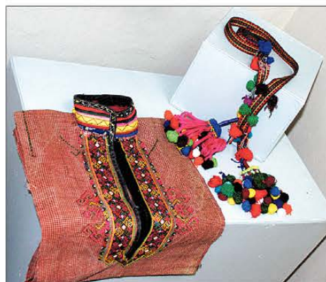
Мари́йский костюм богато украшают самобытной вышивкой, которую располагают у ворота, у грудного разреза, на спине, на обшлагах рукавов и на подоле

– Традиция выращивания растений для прядения и ткачества уже ушла