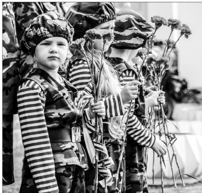
Патриотическое воспитание в Полевском начинается с дошкольного возраста

До конца года в Свердловской области пройдут десятки мероприятий, направленных на патриотическое воспитание молодёжи