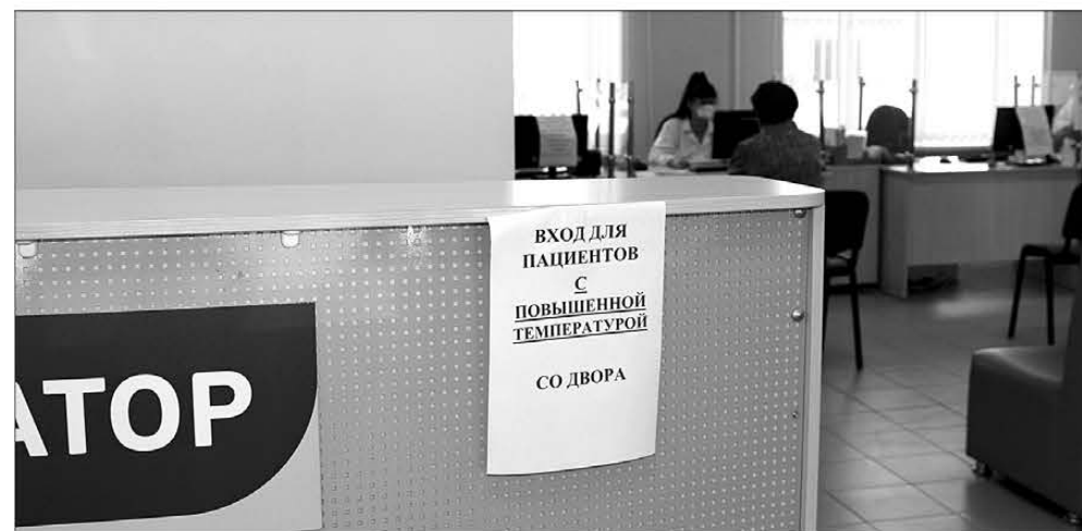
Во взрослых поликлиниках Полевской ЦГБ для удобства пациентов и в целях безопасности соблюдается принцип разведения потоков посетителей

Губернатор Свердловской области поручил организовать приёмы в поликлиниках без скученности в коридорах и длительного ожидания