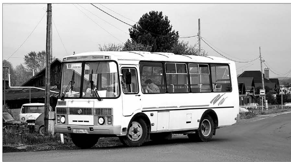
До момента ввода новой схемы общественных перевозок 101-й автобус будет заезжать в микрорайон Берёзовая Роща, на Т-2 заезда не будет

Об итогах работы за 8 месяцев 2020 года присутствующим рассказал начальник