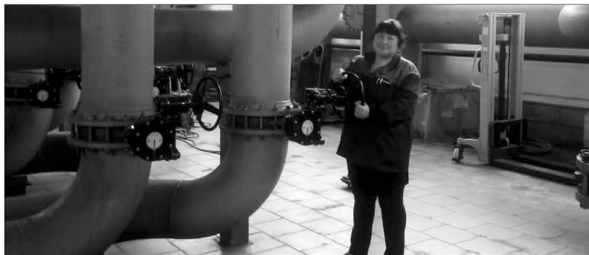
14 сентября были открыты задвижки в теплопунктах, чтобы тепло могло поступать в многоквартирные жилые дома и объекты соцкультбыта

Отоплением в Свердловской области обеспечены половина жилфонда и 83% объектов социальной сферы