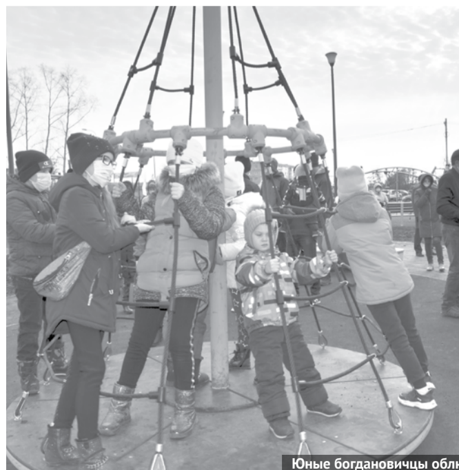
Юные богдановичцы облюбовали качели и карусели.

По задумке архитекторов, которые разрабатывали проект реконструкции парка, идея заключалась в том, чтобы в городе появилось место отдыха, в котором интересно было бы проводить время людям всех возрастов. Первая очередь парка стала ярким уголком детства, который теперь радует богдановичцев и дарит им только положительные эмоции.