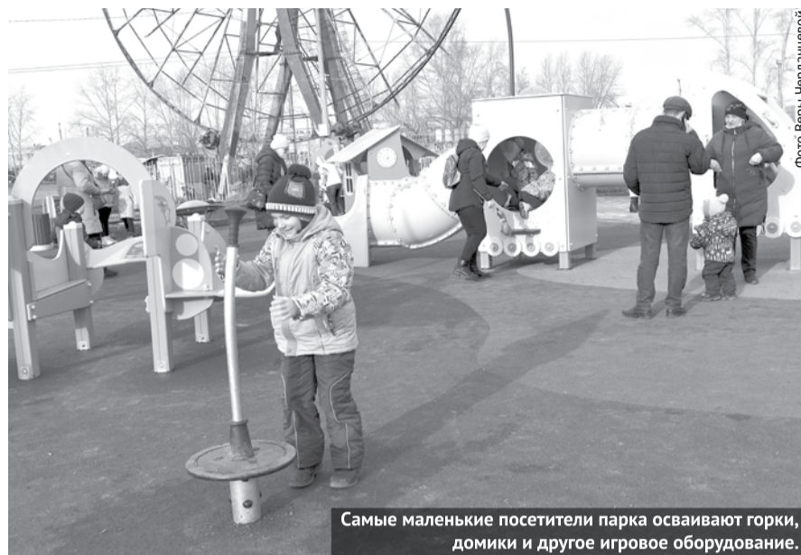
Самые маленькие посетители парка осваивают горки, домики и другое игровое оборудование.

Практически все лето и два осенних месяца в городском парке шли работы по его реконструкции. Здесь было обустроено несколько разновозрастных детских площадок с игровым оборудованием, смонтировано уличное освещение, высажено более 30 видов деревьев и кустарников, установлены скамейки, урны. Теперь в обновлённый парк каждый день приходят взрослые и дети