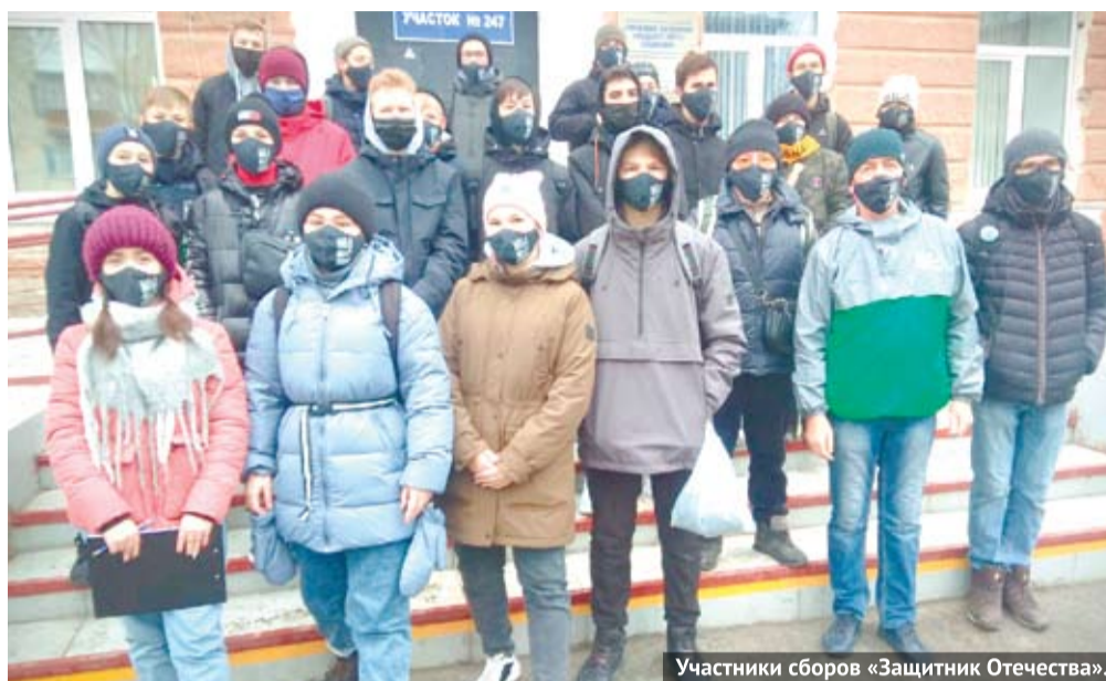
Участники сборов «Защитник Отечества».

В минувшие выходные в Богдановиче прошли военно-патриотические сборы «Защитник Отечества» в рамках проекта «Мы – за мир!», посвящённые 79-й годовщине проведения парада войск Рабоче-крестьянской Красной Армии на Красной площади, который прошёл 7 ноября 1941 года