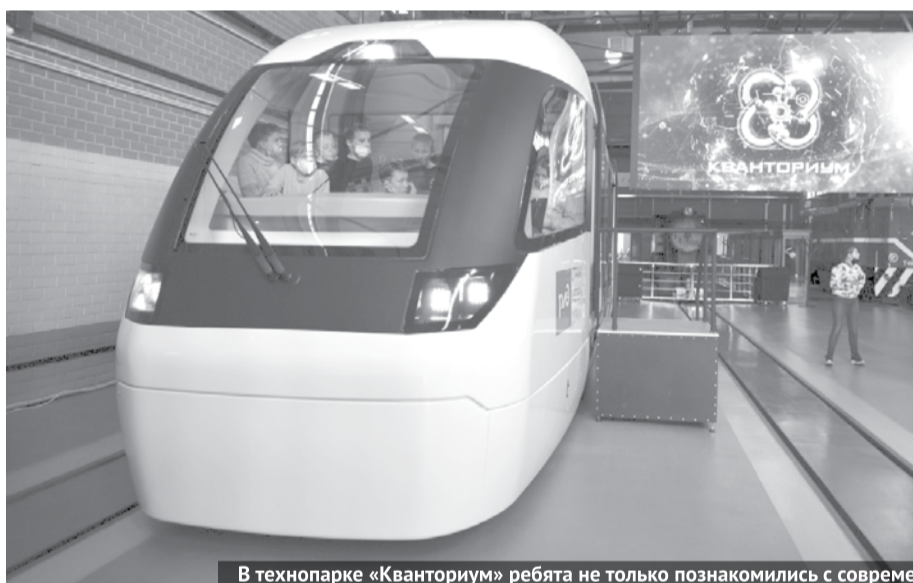
В технопарке «Кванториум» ребята не только познакомились с современным оборудованием, но и попытались собрать робота.