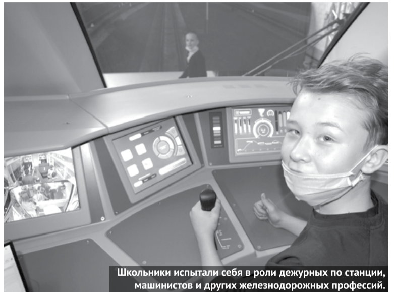
Школьники испытали себя в роли дежурных по станции, машинистов и других железнодорожных профессий.

Это было первое знакомство с железной дорогой и её профессиями. Далее учащиеся профильного класса будут изучать теорию по программе дополнительного образования «Кампус роста» (территория возможностей). Раз в месяц ребята будут посещать детскую железную дорогу, чтобы проходить практику под руководством ее специалистов. А следующим летом школьников ждёт самое интересное - в течение недели они будут проходить практику, во время которой попробуют себя в качестве сотрудников железной дороги, перевозящих настоящих пассажиров.