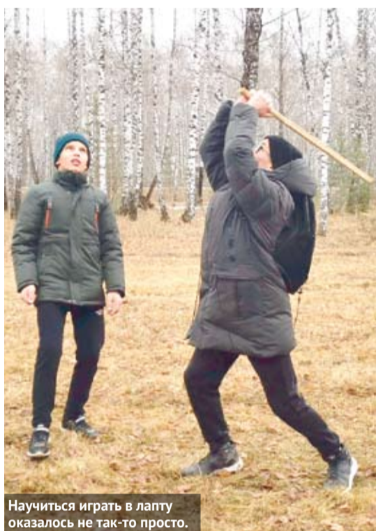
Научиться играть в лапту оказалось не так-то просто.