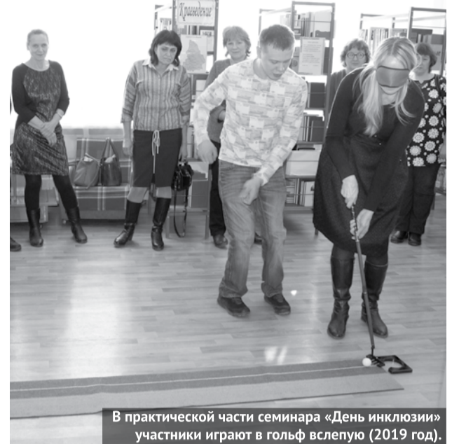
В практической части семинара «День инклюзии» участники играют в гольф вслепую (2019 год).

По данным Всемирной организации здравоохранения ООН, во всем мире насчитывается около 39 миллионов слепых людей и 124 миллиона человек с плохим зрением. К 2025 году количество слепых