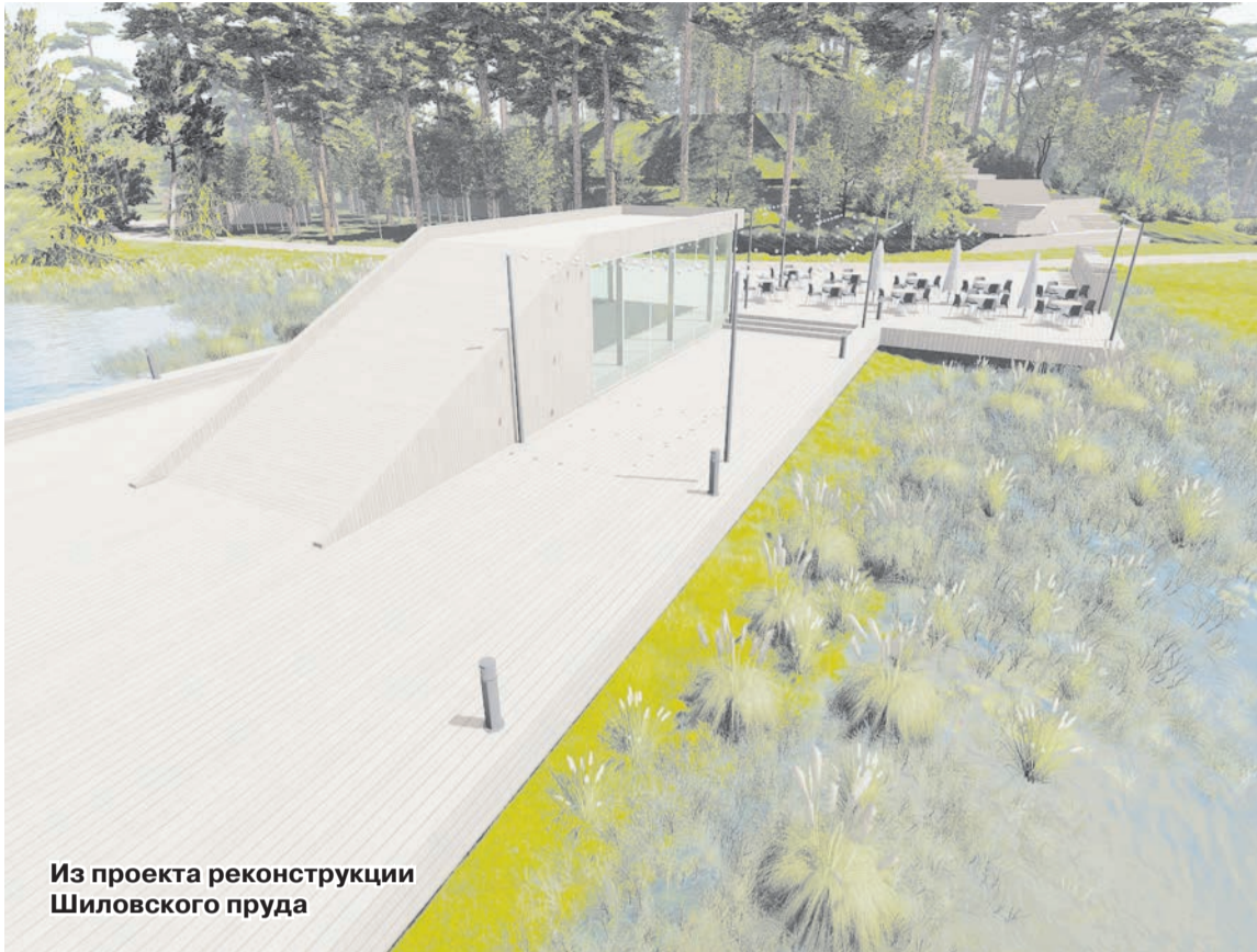
Из проекта реконструкции Шиловского пруда