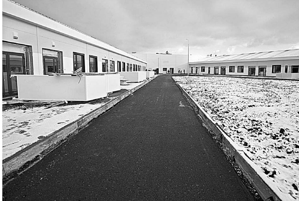
Новый медицинский центр построили за два с половиной месяца.

— Темпами я удовлетворен, — соглашается курировавший возведение медицинского комплекса глава региона. — Впервые мы строим такой объект в такие сжатые сроки, и на будущее это ориентир для нашей строительной отрасли. Сейчас в новый центр, который станет структурным подразделением ОКБ № 3, где развернута обширная ковидная база, завозится медицинское оборудование и мебель. Когда уйдут строители, потребуется навести «стерильный» порядок, подготовиться к началу работы, протестировать всю установленную аппаратуру, приборы, электронику. По словам Алексея Текслера, после передачи всех корпусов медикам в течение 7–10 дней будет проверена полная готовность инфекционной больницы, и в течение первой декады ноября она начнет принимать пациентов. ●