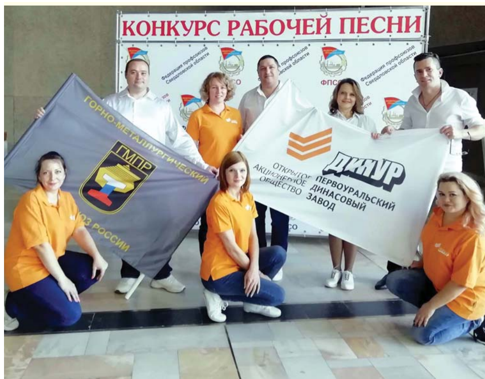
Заводские конкурсанты - с группой поддержки.