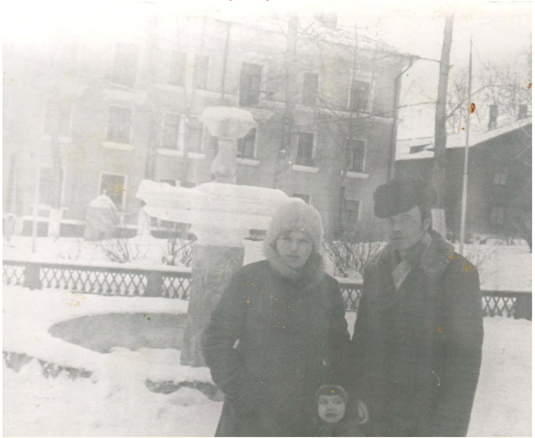
Таким был Динас в конце семидесятых.