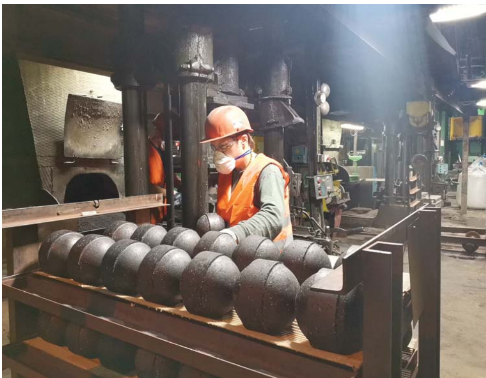
На формовке изделий марки ШВГ.