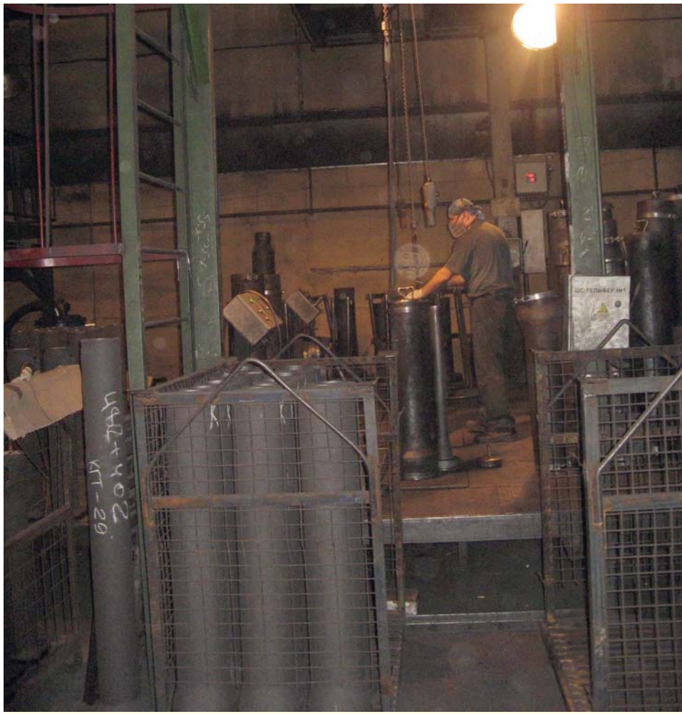
На протяжении полугодия коллектив участка по производству корундографитовых изделий делает по 170-180 тонн в месяц.

- Каждый день подкидывает новые. Производство есть производство. Решаем в рабочем порядке. По комплектующим, своевременно-