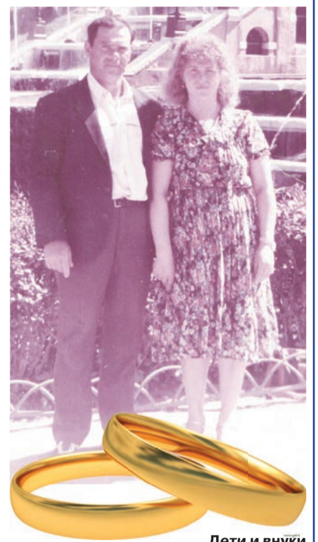
Дети и внуки

Желаем здоровья и только здоровья вам. Спасибо вам за вашу заботу о нас и наших внуках. Годы летят как птицы, но ваша любовь остается в наших сердцах. Оставай- тесь любимы и преданы друг другу в ваших семейных делах!