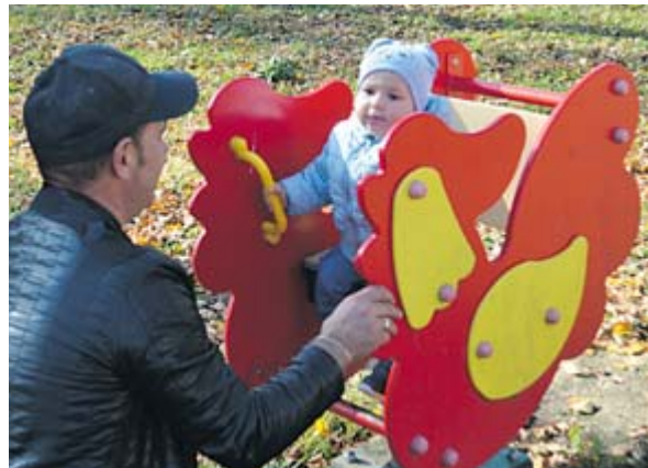
На новой площадке развлечения на любой вкус и возраст