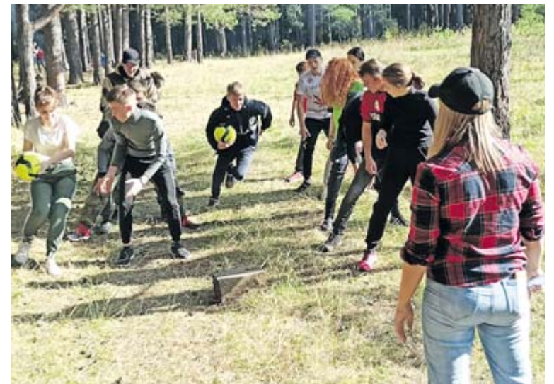
Один из этапов – эстафета с мячом

По итогам состязаний лучшей признана команда «Лесовички».