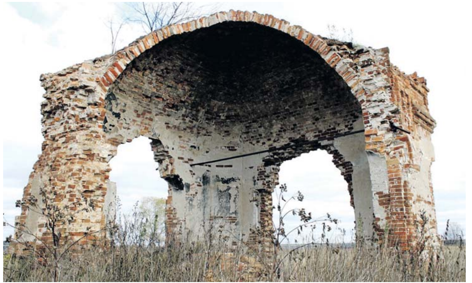
■ Всё, что осталось от часовни