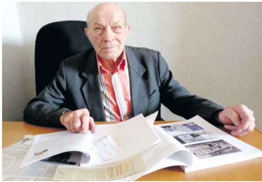
■ Листая страницы памяти

ющий от государства пособие, он закончил жизнь бесславно.