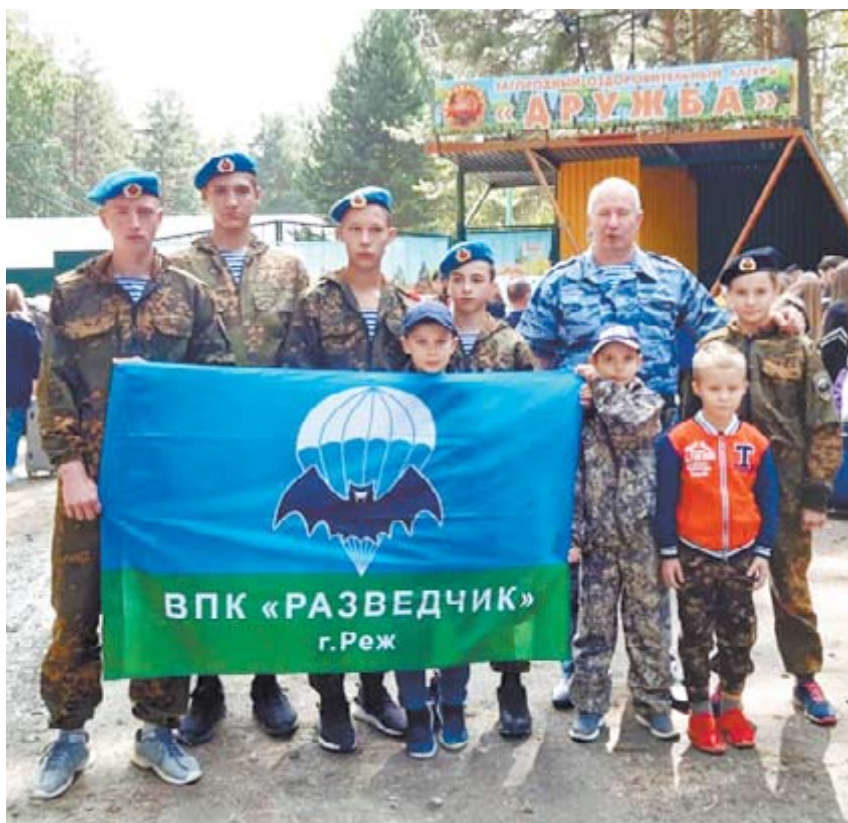
Впечатления от лагеря «Дружба» у ребят из «Разведчика» положительные!

Главная цель участников поискового отряда «Рысь» – поиск без вести пропавших солдат. Под чутким руководством Олега Кузьми-