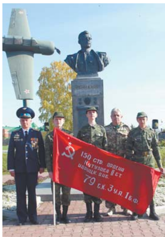
Отряд «Рысь» награжден копией Знамени Победы

Подготовила Дарья ОБЛАСОВА