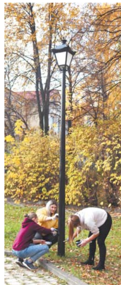
Ребята из клуба «Молодой избиратель» ухаживают за памятником воинам Афганско-Чеченской войны

В начале сентября в свои ряды члены клуба приняли первокурсников. Для них были проведены классные часы, во время которых ребятам вручили значки клуба и рассказали о принципах работы. В конце сентября «Моло-