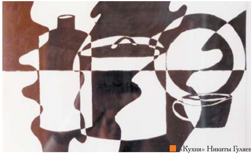
«Кухня» Никиты Гуляева