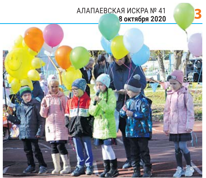
Поздравления от самых юных

Я как депутат бываю в разных муниципальных образованиях. Не везде люди поддерживают инициативное бюджетирование, не везде готовы вкладывать свои средства, хотя это их родная земля, где они гуляют и отдыхают со своими детьми и внуками.