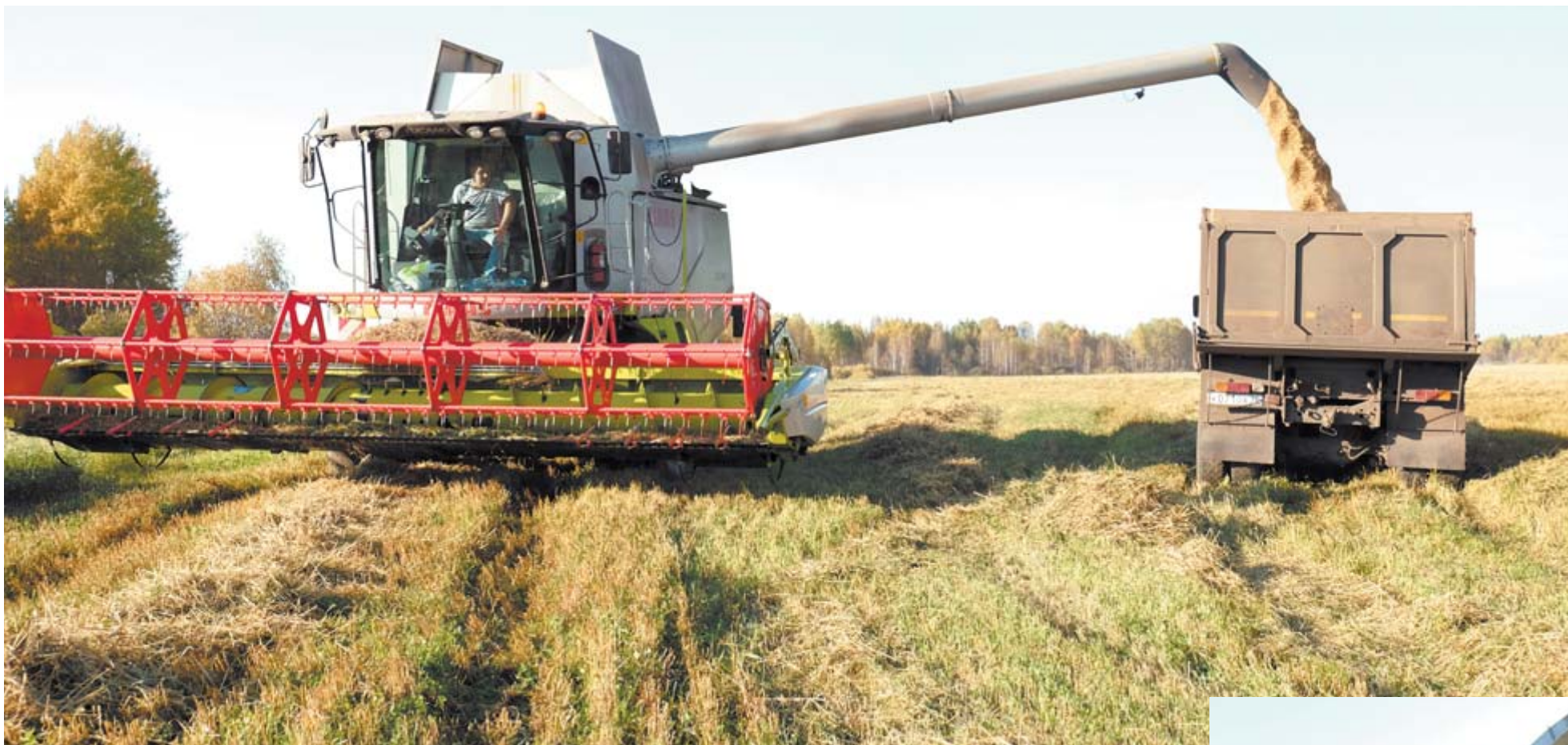
Уборка урожая в «Колхозе имени Чапаева»