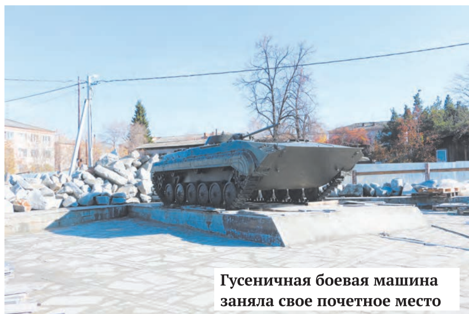
Гусеничная боевая машина заняла свое почетное место