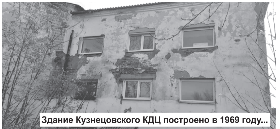
Здание Кузнецовского КДЦ построено в 1969 году...

Дополнительное финансирование по итогам согласительной комиссии получит и сфера образования. 6 миллионов 135 тысяч рублей будут направлены на ремонт МКДОУ «Детский сад № 14 «Солнышко». Вопрос выделения средств согласован и поддерживаются главой региона Е. Куйвашевым и председателем