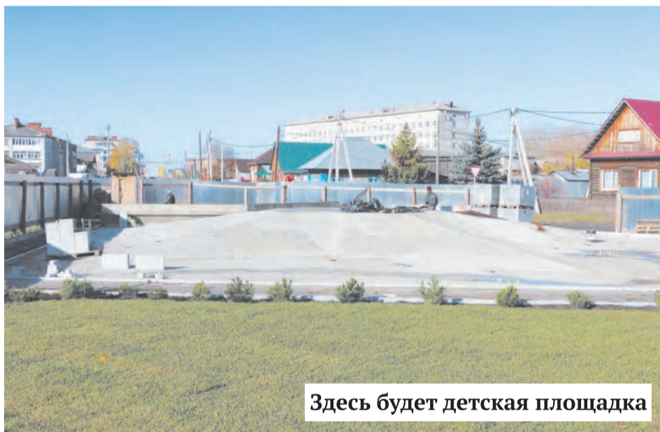
Здесь будет детская площадка

– Кроме того, в данный момент управление городского хозяйства занимается формированием бюджета по уличному освещению на следующий год. Жители могут оставить заявки на установку све-