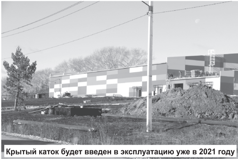
Крытый каток будет введен в эксплуатацию уже в 2021 году

На реализацию мероприятий по энергосбережению и повышению энергетической эффективности выделен 31 миллион 870 тысяч рублей. В 2019 году и за текущий период 2020 года заключено три муниципальных контракта на общую сумму 145 миллионов 843 тысячи рублей, в том числе с оплатой в 2021 году порядка 53,5 млн. Согласно условиям контрактов, подрядчик выполняет ремонт сетей холодного и горячего водоснабжения, водоотведения, сетей теплоснабжения в с. Елань, п. Троицком и г. Талице, в том числе с подключением к жилым домам. Контракты предусматривают выполнение комплекса работ по монтажу блочно-модульных установок по очистке воды в с. Басмановском и п. Пионерском. Также по условиям установка станций водоподготовки (системы очистки) сетей холодного водоснабжения по улицам Пушкина, Молодежная, Советская, 65. Сразу отметим, что большая часть работ подрядчи-