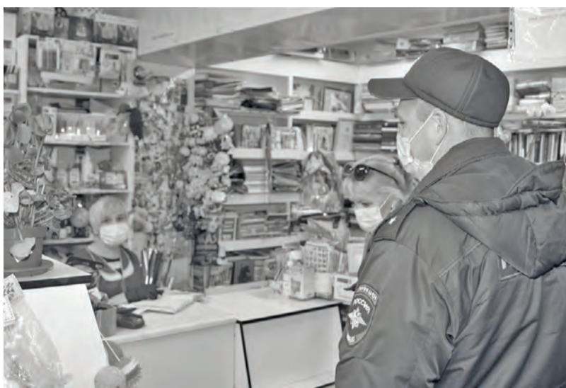
● Рейды по предприятиям торговли в Бисерти

Первые рейды по проверке соблюдения масочного режима прошли по Свердловской области уже в минувшие выходные - и за два дня более полутора тысяч уральцев уже нарвались на штрафы за отсутствие масок. Штрафные санкции, кстати говоря, чем дальше - тем суровее: на данный момент за нарушение масочного режима