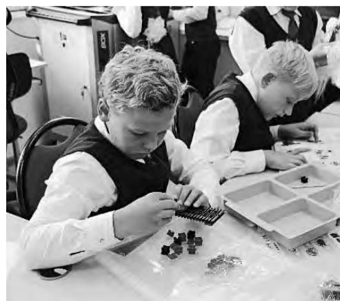
Фото Талицкой школы №1.

Отметим, что в рамках нацпроекта «Образование» в сентябре этого года по всей России открылся 2951 центр образования цифрового и гуманитарного профилей «Точка роста», из них 42 центра в Свердловской области. Всего с 2019 года в 81 субъекте России в школах сельских территорий и малых городов создано 5000 таких центров.