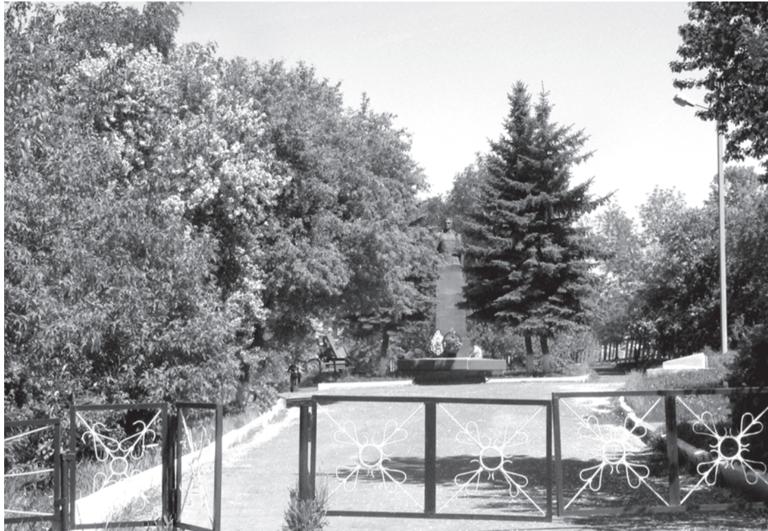
2007 г., г. Taliца, сквер имени Н.И. Кузнецова.

Каждая фотография должна сопровождаться информацией о том, когда и где она сделана, что на ней изображено (или кто изображен), от кого получена.