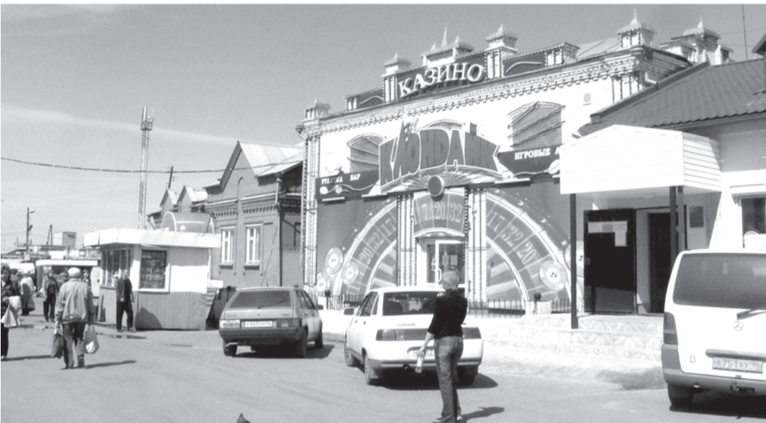
2007 г., г. Taliца. Торговая площадь в г. Taliце.