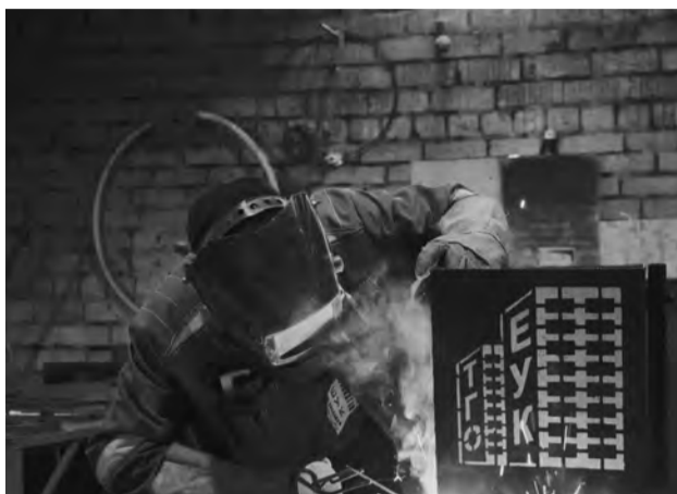
Территория обслуживания МУП ТГО «Единая управляющая компания ТГО» обширна – это МКД в г.Талице, пос.Троицком, с.Елани, Бутки, Смоленском, Н.Катарач, Трехозерке, Казаковском, Басмановском, пос.Пионерском, Завьяловском, Кузнецовском.

да по ул.Мира, 38 в пос.Троицком. Продолжаются работы по ул.Энгельса, 6, - проводится капремонт фасада, замена старых деревянных окон в подъезде на пластиковые.