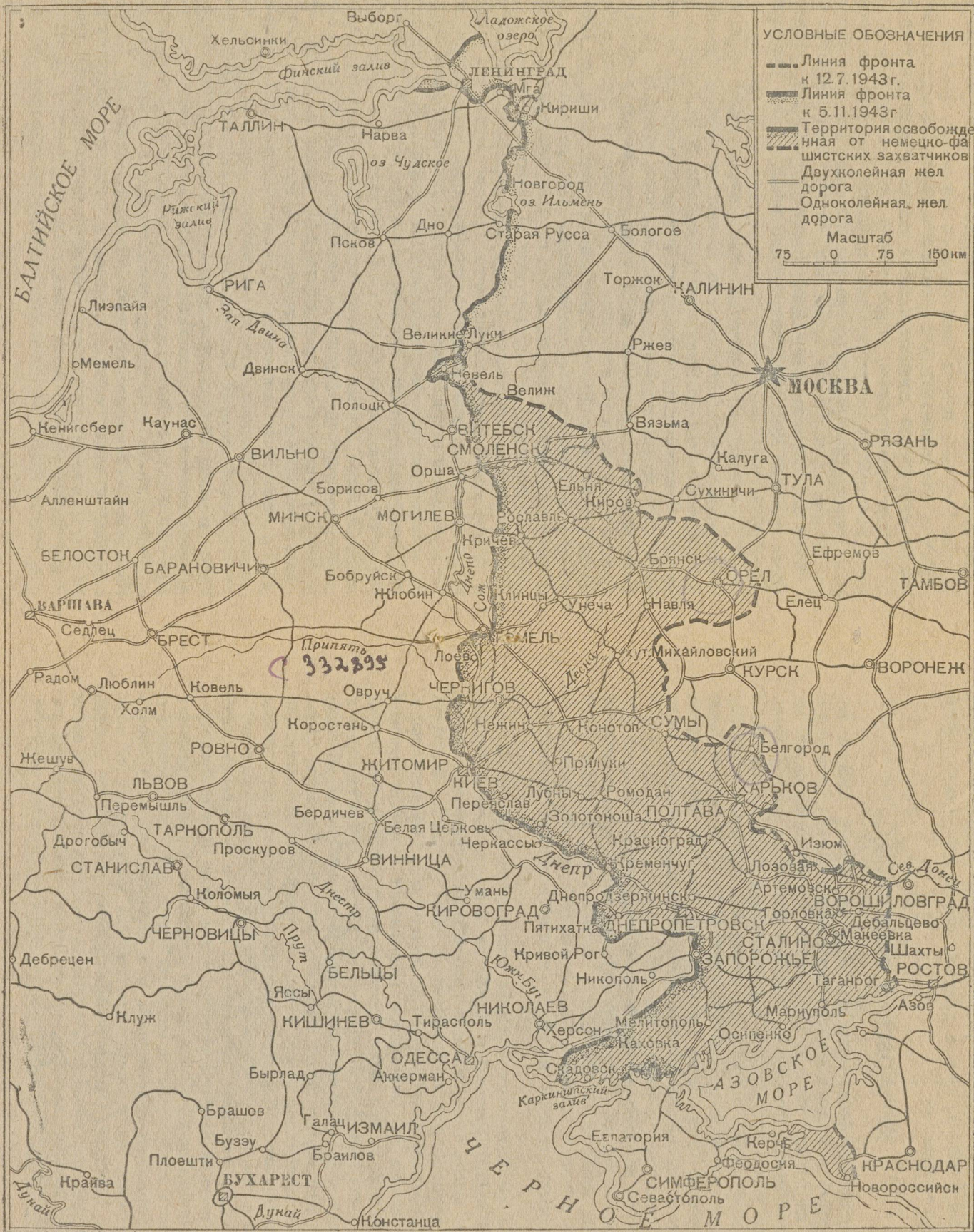
Размеры территории, освобожденной Красной Армией от немецкой оккупации за период с 12 июля по 5 ноября 1943 г.