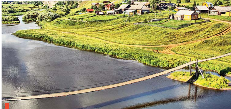
Вид на село Чусовое с Шайтан-камня

16 лет в селе Чусовом действует интеллектуальный лагерь для старшеклассников «Сигма». Русский язык, математику, историю ребятам преподают кандидаты наук. Их задача – показать достоинства русского литературного языка, прелесть математики и необходимость знания истории для понимания современной жизни.