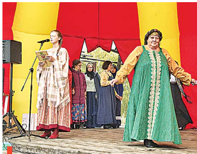
Демонстрация косоклинного сарафана на фестивале «Баской крой»

В этом году копилка шалинского событийного туризма пополнилась региональным фестивалем народного костюма «Баской крой». Он проходит при поддержке Фонда президентских грантов в рамках одноименного проекта АНО «Издательский дом «Кремлевский стан» (руководитель Дмитрий Сивков) по возрождению и популяризации традиционного горнозаводского костюма. По имеющимся в музее Староуткинска, Шали, Чусового экспонатам команда «Баской крой» создала несколько народных костюмов. Круглые и косоклинные сарафаны, рубахи и кофты, порты и картузы, распространенные среди старообрядцев более 100 лет назад, были представлены на фестивале.