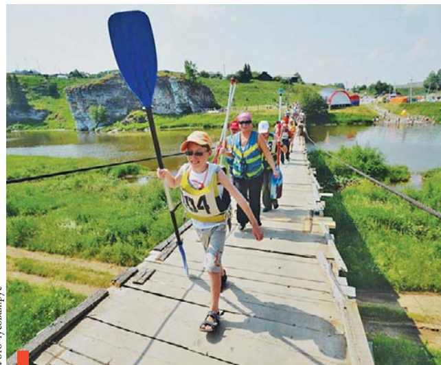
Фестиваль «Чусовая России»