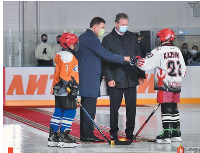
Евгений Куйвашев и Андрей Козицын дают старт дружеской встрече юных хоккеистов из Сухого Лога и Пышмы