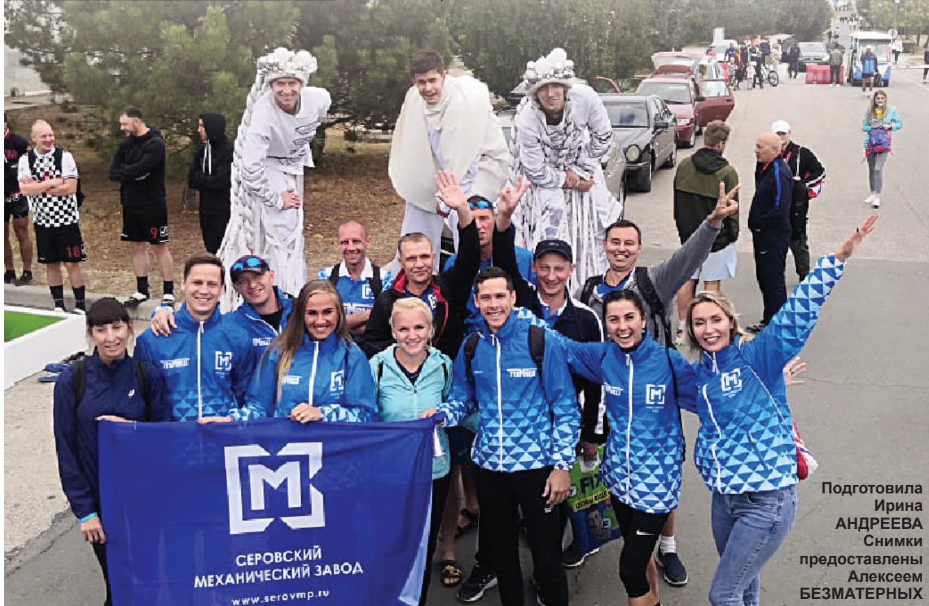
Подготовила Ирина АНДРЕЕВА