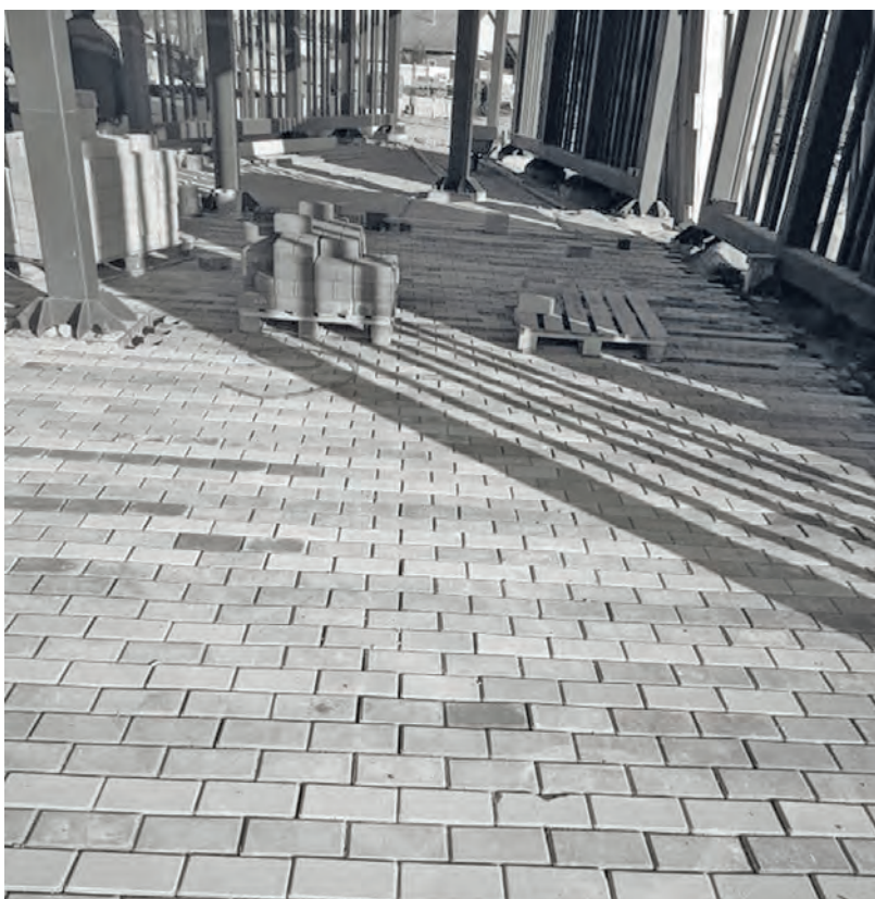
● Идёт укладка тротуарной плитки и остекление павильонов

Дорога по Тимирязева, хоть и была начата позже сквера, уже почти готова к завершению: асфальтирование завершено на 99%; дорожная разметка уже нанесена; дорожные знаки уже установлены. Из несделанного на данный момент лишь установка остановочных комплексов поселкового автобуса, высадка газонной травы вдоль проезжей части, асфальтирование подъездов к нескольким домам и