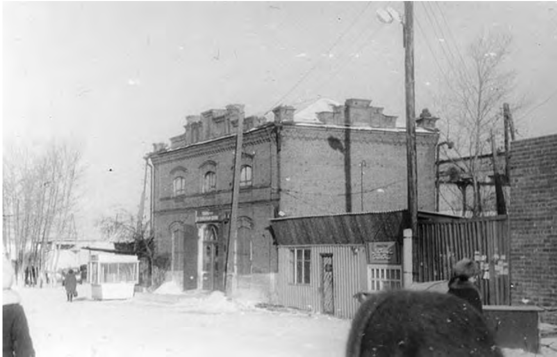
1960 г. г. Талица. Магазин «Товары по сниженным ценам».

Каждая фотография должна сопровождаться информацией о том, когда и где она сделана, что на ней изображено (или кто изображен), от кого получена.