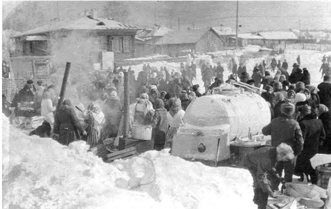
1960 г. г. Талица. Проводы русской зимы. Вдали - здание аптеки.