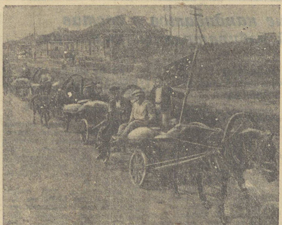
Красный обоз колхозников Каменского района направляется на осенний пункт Заготзерно.

Потем Урала, разработка его неисчерпаемых природных богатств была немаловажной без привлечения научных сил, без подготовки кадров своих, преданных советской власти, специалистов.