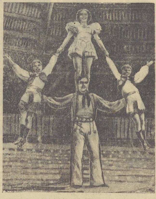
Перед открытием Свердловского цирка. На снимке: один из номеров труппы Оксанос.