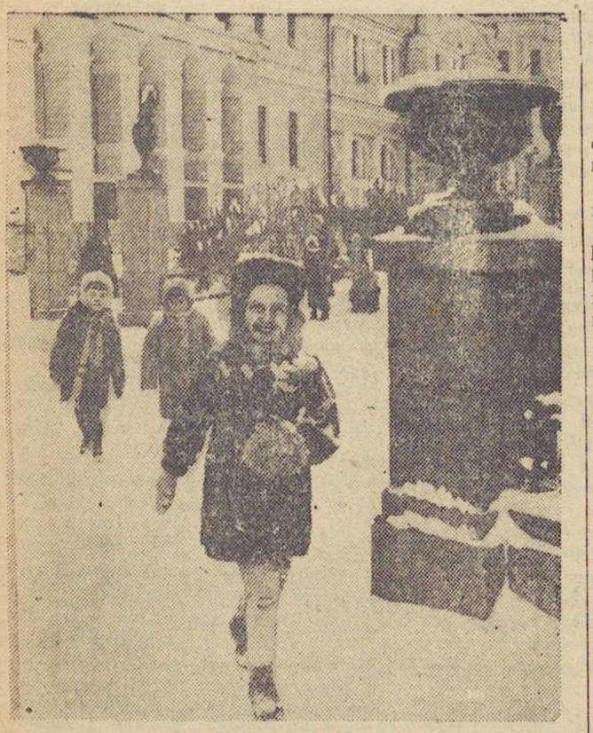
Первый снег в Свердловске. Девочка высылала на улицу.