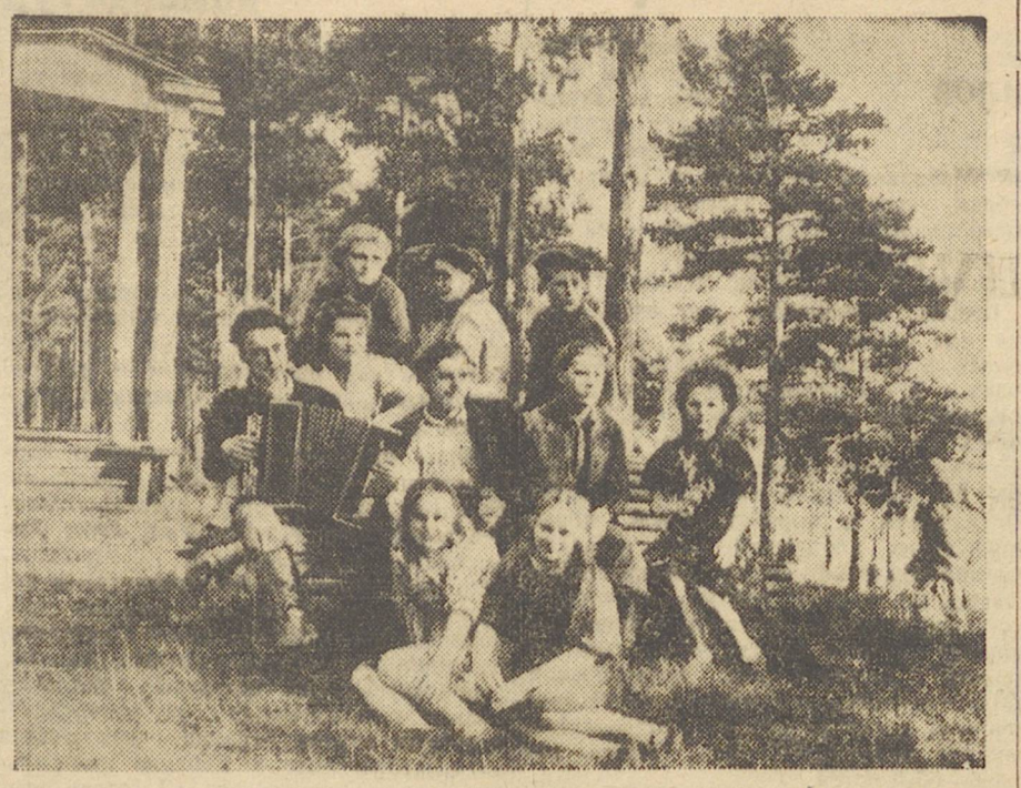
Отдыхающие в выходной день в Парке культуры и отдыха им. Маяковского.

Пловцы выехали во Львов. В сборную команду Свердловска включено 16 лучших пловцов во главе с тренером командой и чемпионом города тов. Карповой.