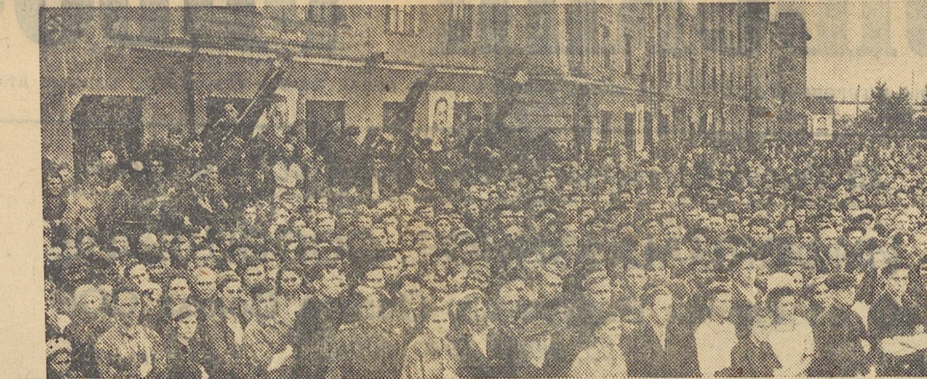
Митинг на Уральском артиллерийском заводе им. Сталина в связи с награждением завода орденом Отечественной войны I-й степени.