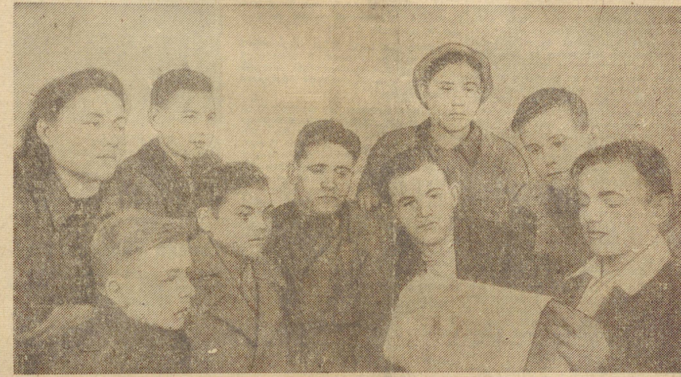
Фронтная молодежная бригада электрослесарей Пышминского медьэлектролитного завода, ставши на Сталинскую вахту, взяла обязательство — выполнять новые повышенные нормы на 120 процентов. В первый же день вахты бригада выполнила норму на 122 процента.

Дни подготовки к подписанию годового отчета уральцев товарищу Сталину коллектива завода ознаменовал досрочным выполнением квартального плана выпуска запасных частей. Вчера заказ полностью сдан — областной конторе «Тракторосбыт».