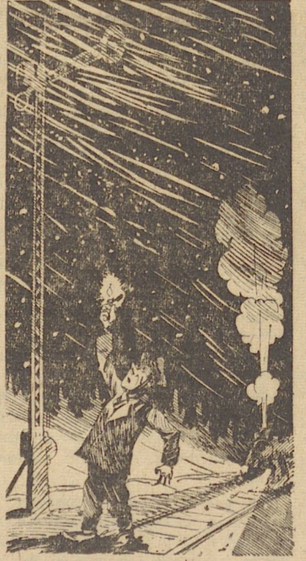
Понапрасну ищет взор Долгожданый товарищ. А найдет, так тоже зря — Не увидит фонаря. Не понять: какой там цвет? Можно ехать или нет? Да как же будет пар Дзасекречен semaфор?