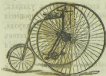
THE SANDRINGHAM CLUB

всѣхъ системъ и принадлежности къ нимъ же.