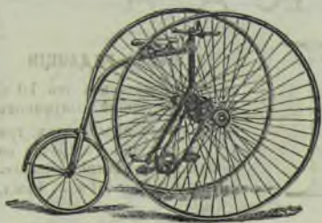
THE SANDRINGHAM CLUB