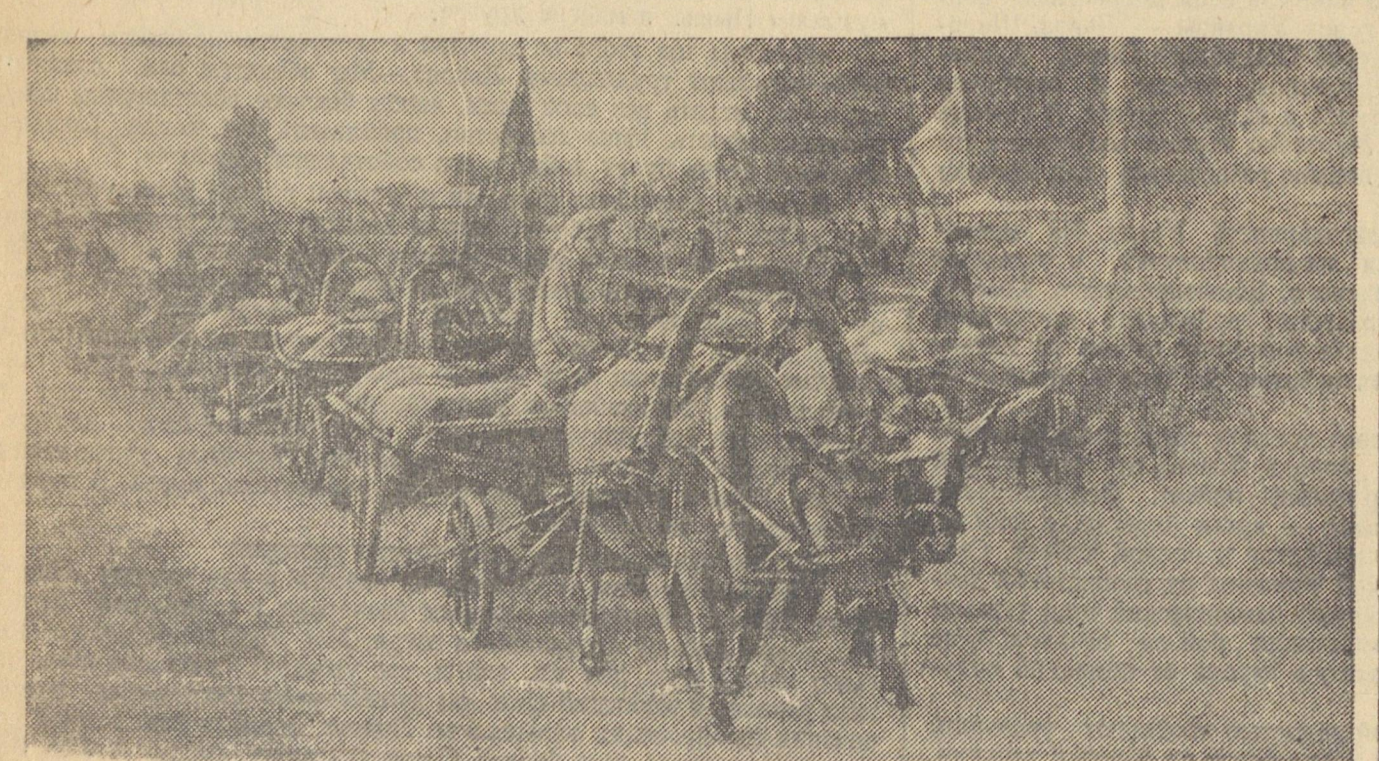
Красный обоз с хлебом в честь побед Красной Армии отправлен на государственные склады колхоза имени Буденного, Мартыновского сельсовета, Пышминского района. На снимке: красный обоз на пути к элеватору.

КАМЕНСК, 24 августа (по телефону). По инициативе комсомольцев здесь проведена на полях фронтальная работа. Члены райкома ВЛКСМ а весь комсомольский актив провели беседы с молодежью. Молодежь живо откликнулась на призыв комсомола. 800 человек работало в эту ночь на полях. Они скледили молотки, сортировали зерно. И несмотря на то, что ночь была темная, молодежь заскороудила 200 гектаров, имолодильно 5,5 тысячи пудов хлеба и отсортировала 600 пудов зерна.