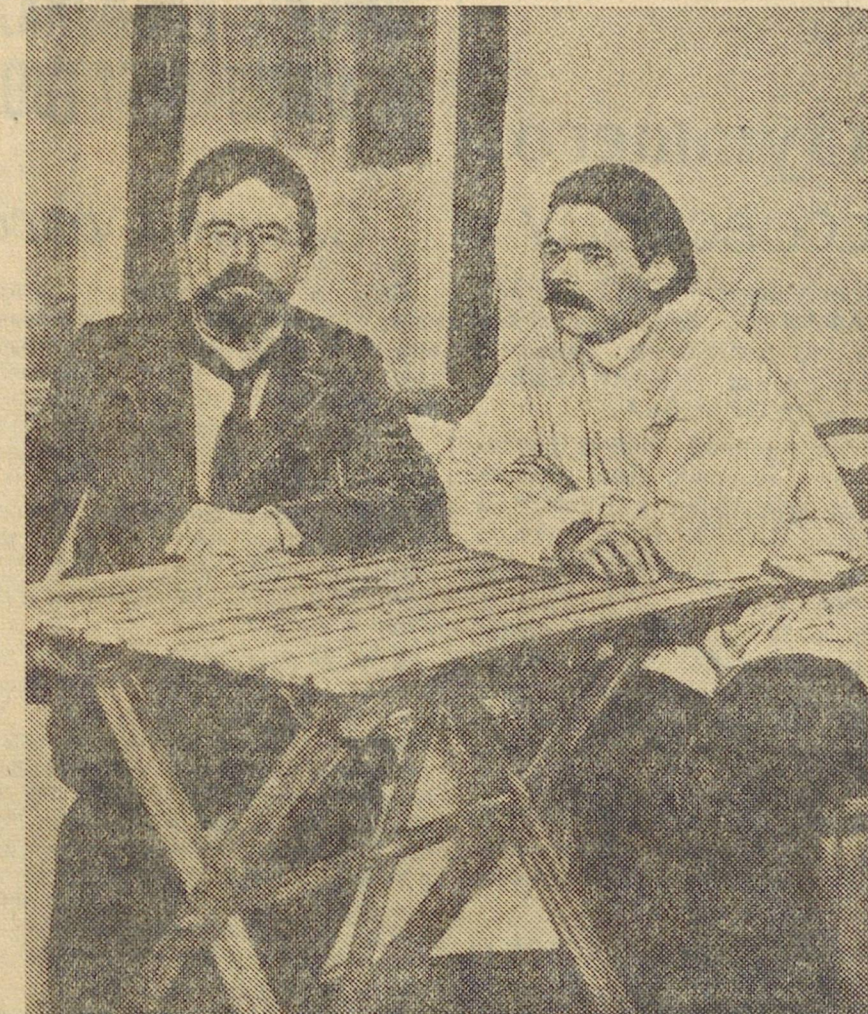
М. Горький и А. П. Чехов (снимок 1901 г.)

— революция! Он был прямым предшественником Горького, Антон Павлович чувствовал, что русский народ уже выдвинул борьбу за счастье. Ленин и восторженно приветствовал этих новых героев в лице революционного рабочего Николая, героя пьесы Горького «Мещане».