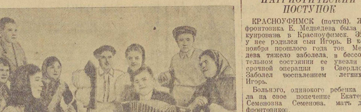
С большим успехом прошел смотр художественной самодеятельности в селе Романово, Серовского района. На снимке: подпольщики советской деревни в исполнении хорошего кружка колхоза «Искра».

Господарственный театр оперы и балета имени А. В. Луначарского. Сегодня НАДЕЖДА СВЕТЛОВА 19-и КАРМЕН. Звердовский государственный драматический театр. Сегодня и 19-и ПОЛОЧНИЦА 0-и ДАМА-НЕВИДИМКА. Свердловский государственный театр музыкальной комедии. Сегодня КОЛОКОЛА КОРНЕВИЦА 19-и НИТУШ. Концертный зал Госфильмофонии. Сегодня творческий ВЕЧЕР артистов Свердловского театра музыкальной комедии 19-и МАРГЕНЦ 19-и КАМЕРНЫЙ КОНЦЕРТ памяти А. С. Даргомыжского. Сегодня в кинотеатрах: СОВКИНО — Дюжорж из Линки-жака; ТЕМП — Дюжорж из Линки-жака; МОД — Вованшине; ОКТАВЬЕ — Овист Максимка; СТАЛЬ — Другая встречающая вновь.