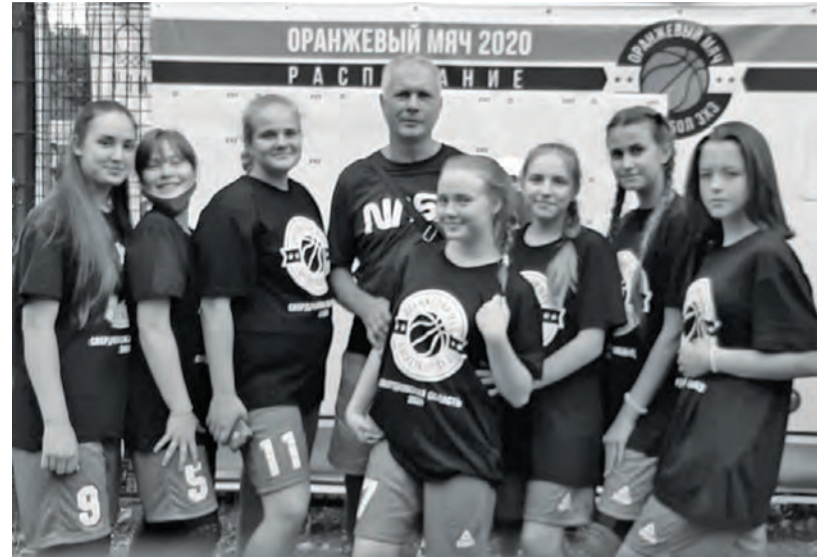
● Бисертская команда

Центральным стартом на Среднем Урале стали соревнования, прошедшие в Екатеринбурге в саду имени Павлика Морозова на площадке центра уличного баскетбола Brand New Park. Там при поддержке минспорта Свердловской области, Центра по организации проведения спортивных мероприятий Свердловской области, Федерации баскетбола Свердловской области и администрации Екатеринбурга собрались более ста команд, которые разыграли награды в восьми возрастных категориях.