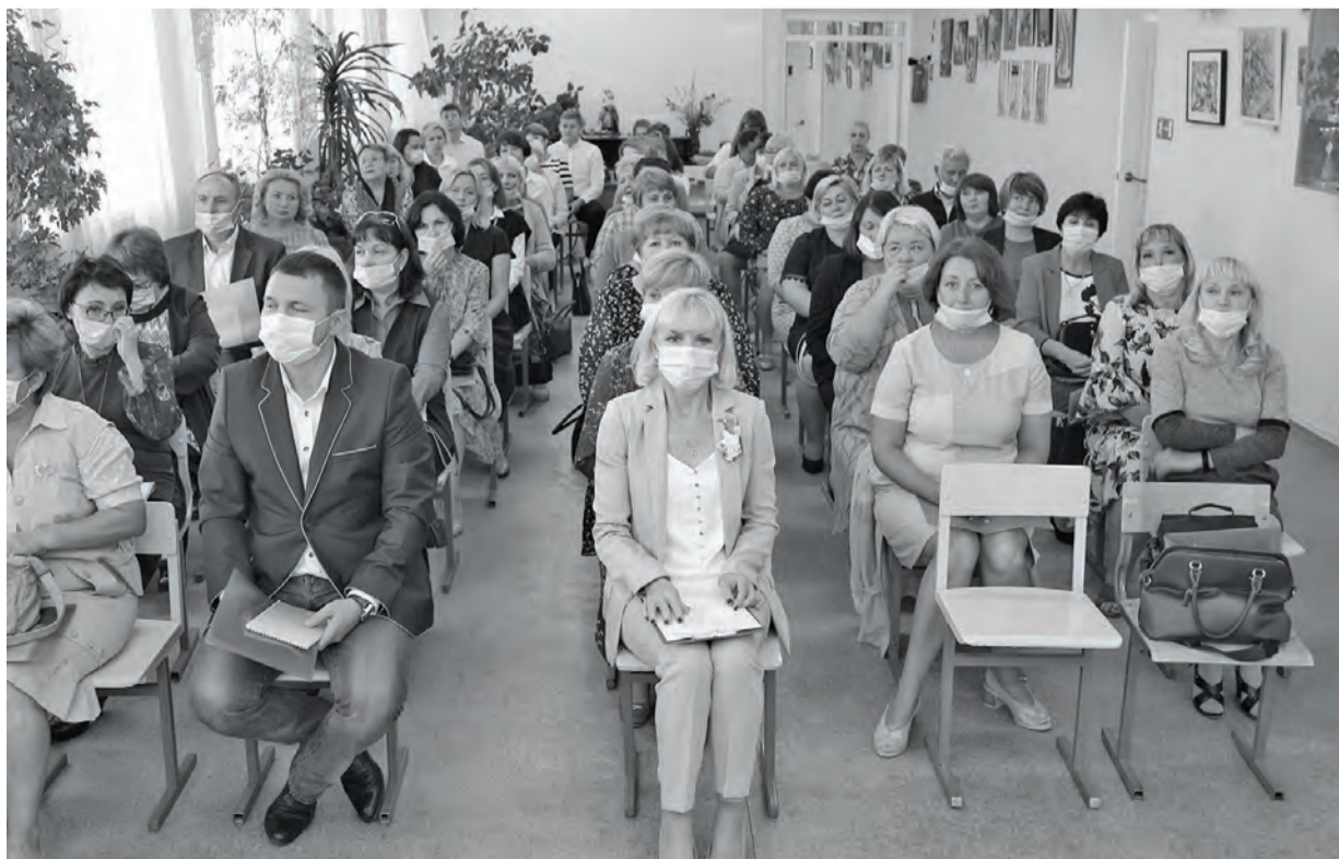
● Даже общее фото на педконференции делалось с учётом коронавирусных мер безопасности - в масках, и с соблюдением санитарной дистанции