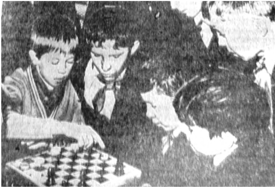
1974 г. Пионерская комната во В-Юрмытской школе никогда не пустует.