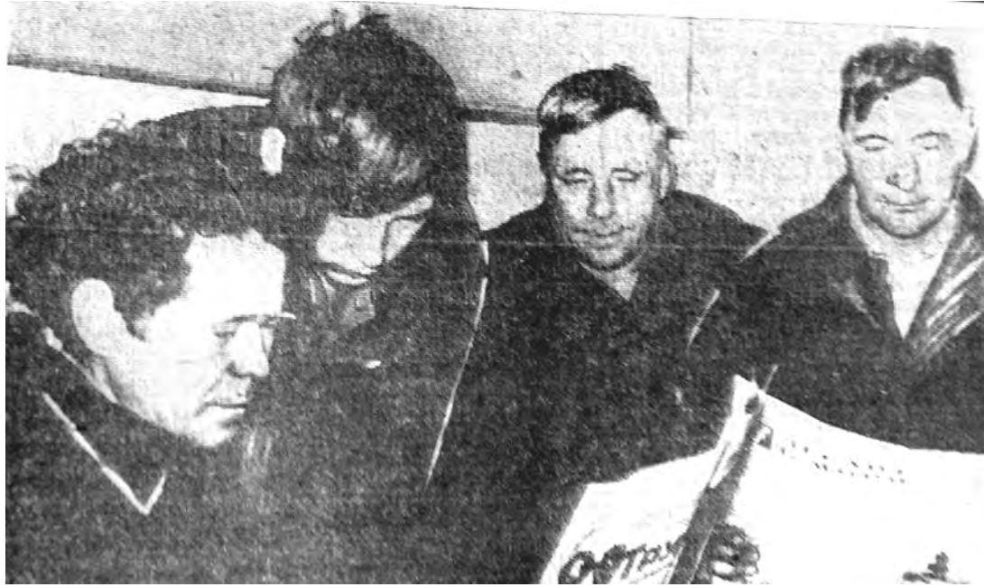
1974 г. В обеденный перерыв в мастерских колхоза «Путь к коммунизму» механизаторы читают свежую газету.

Каждая фотография должна сопровождаться информацией о том, когда и где она сделана, что на ней изображено (или кто изображен), от кого получена.