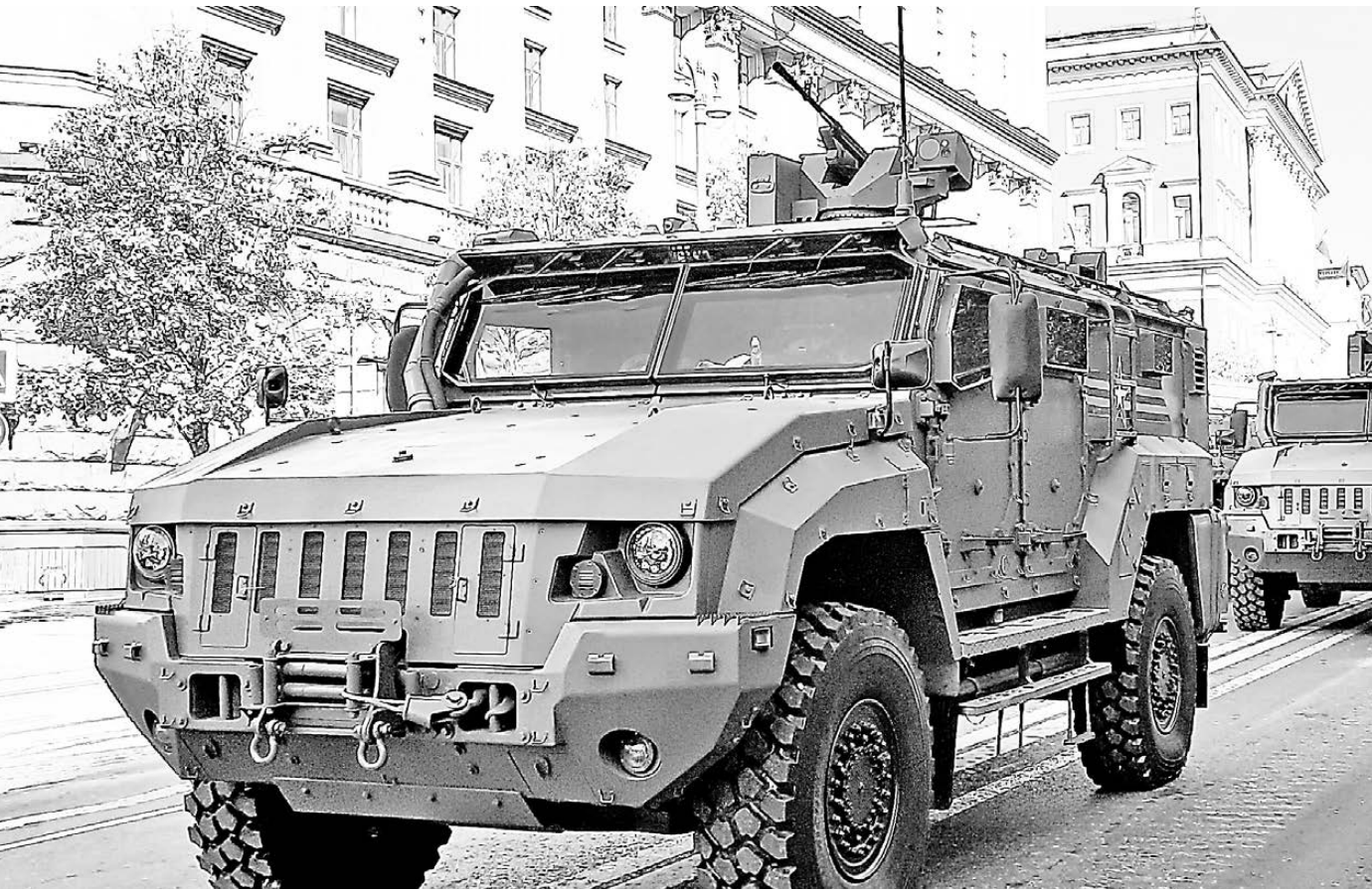
АВТО ИФО - ЭЛЕКТРОНИКА