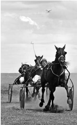
РИСС СЛУЖБА МИНСКЛАДА ЧЕЛЯБИНСКОЙ ОБЛАСТИ

Отметят и конников на чистокровных скаковых лошадях: орловских рысаков и русских верховых. Для зрителей, по словам организаторов, подготовлена развлекательная программа, розыгрыши и викторины. А желающие смогут испытать нормативы ГТО на оборудованной площадке. ●