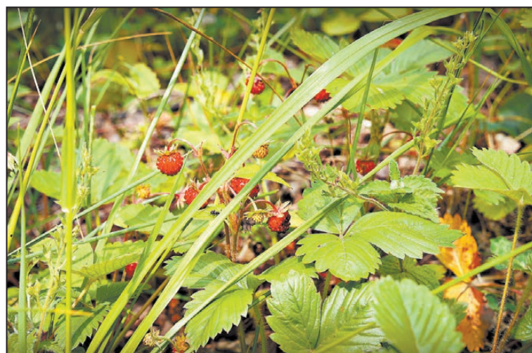
Земляничная поляна.