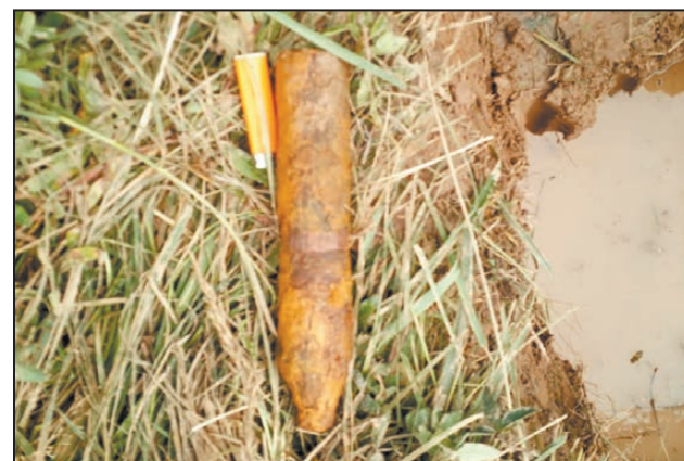
Снаряд от сорокопяти