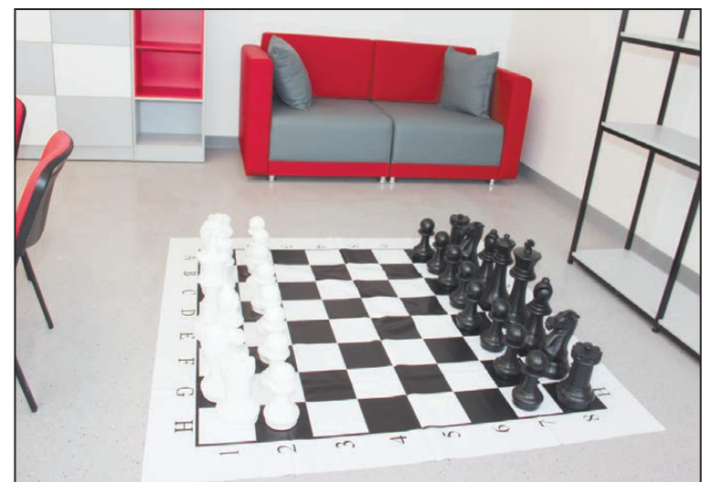
Напольная шахматная доска

Мы идем в кабинеты центра «Точка роста». Они отличаются