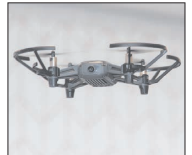
Квадрокоптер в полете