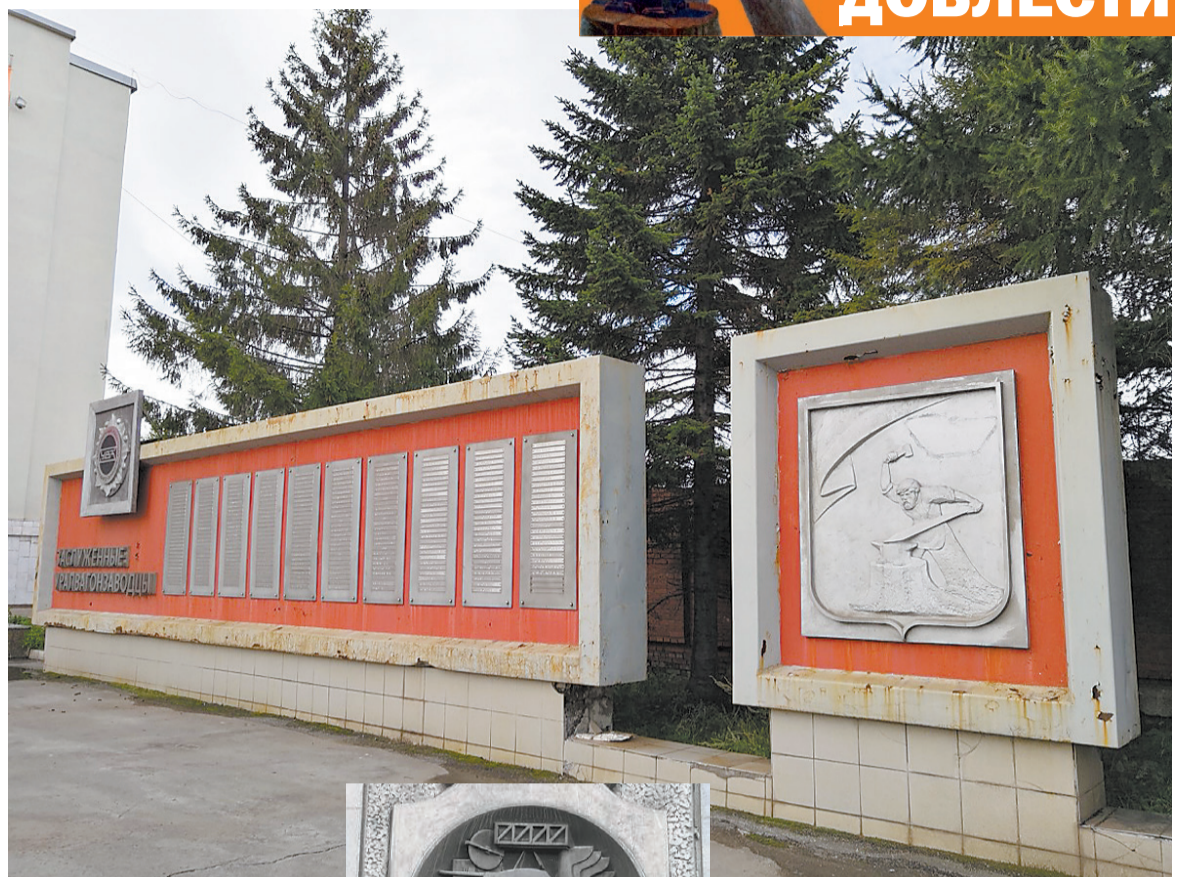
Еще один вариант известной картины «Седой Урал кует Победу».

А можно пройти прямо, мимо «директорского дома», к школе № 9, где установлены памятная доска: здесь в годы войны располагался эвакогоспиталь, и обелиск с именами учителей и учеников, не вернувшихся с фронта.