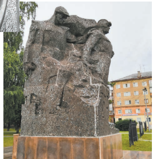
Памятник танкисту и танкостроителю на площади Славы.