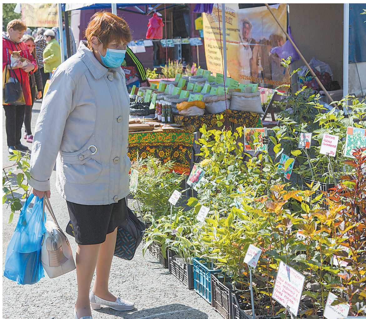
Действительно, глаза разбегаются.