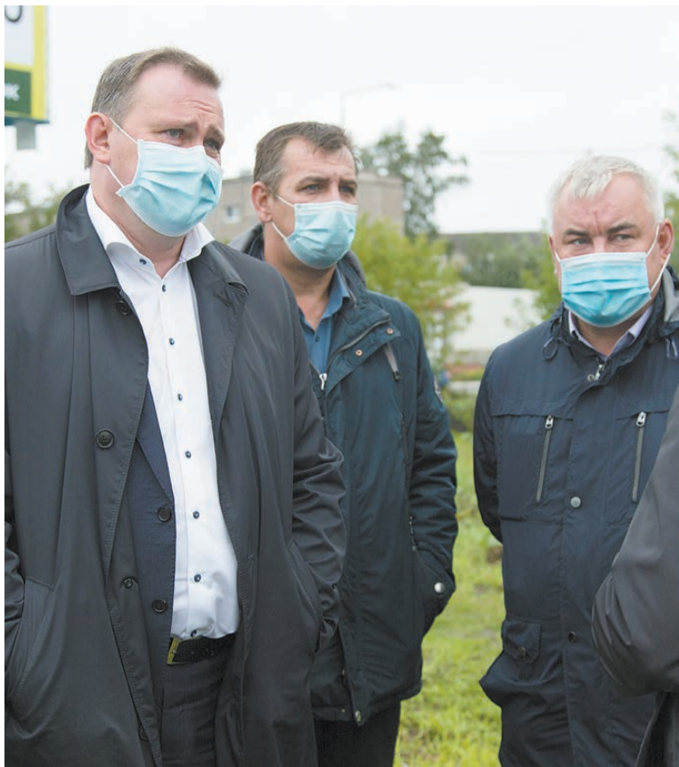
В ходе объезда.

Пострадало не столько дорожное хозяйство, сколько коммунальное. Вода, особенно в местах, где нет ливневки, хлынула в канализационные сети Водоканала, специалисты которого всю неделю работают в авральном режиме - в «узких местах» начались затопления.