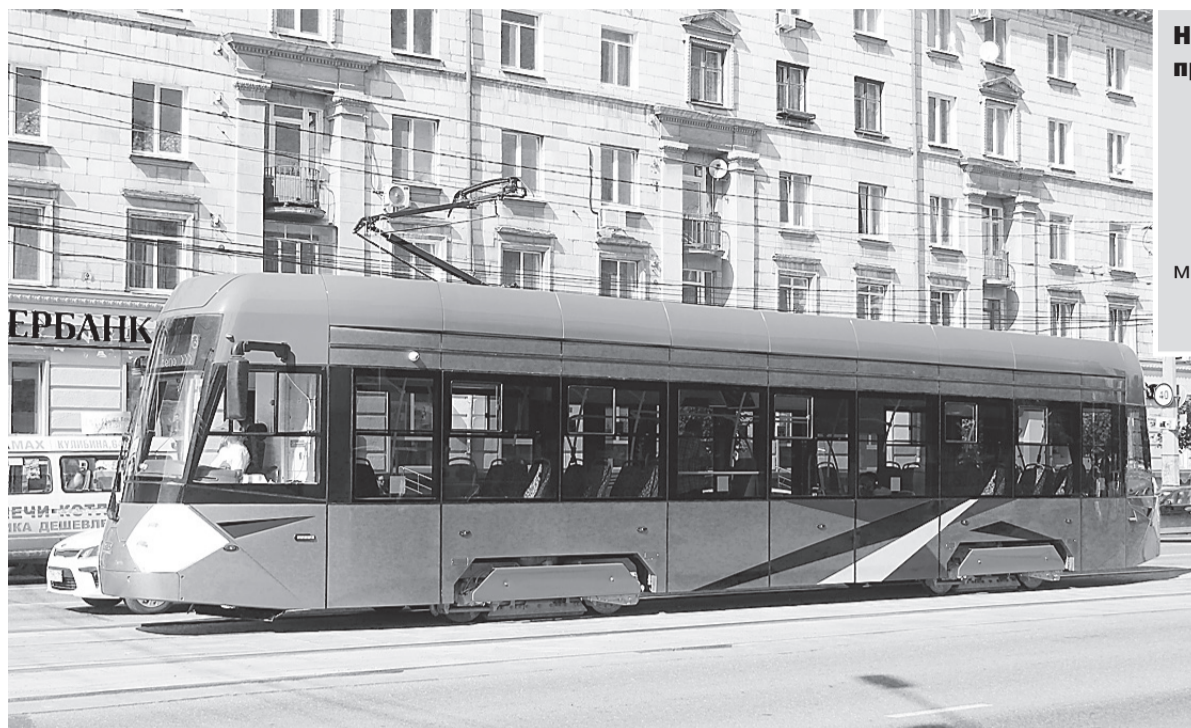
Конечная остановка – "Драматический театр".