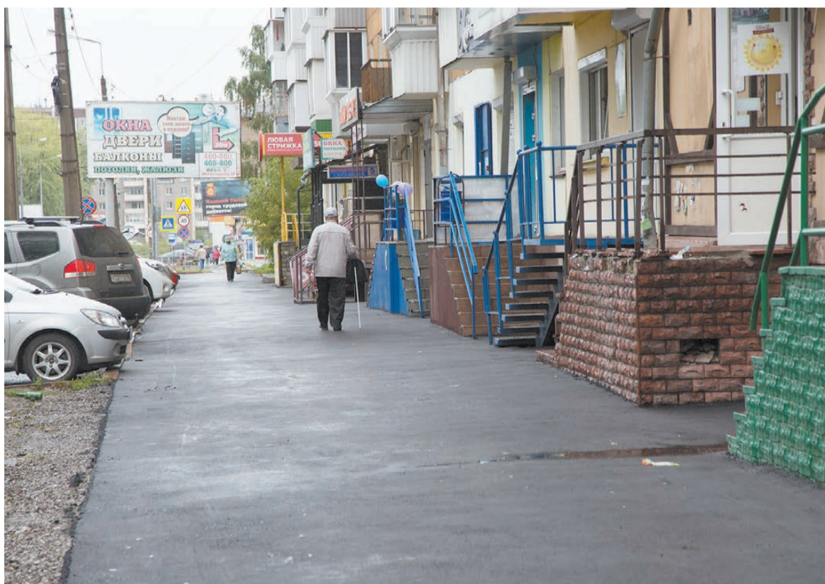
Отремонтированный тротуар на улице Металлургов.