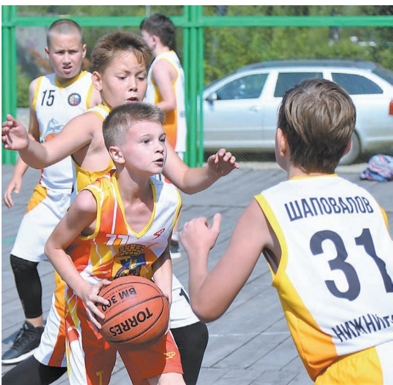
Горноуральский – против Нижнего Тагила.