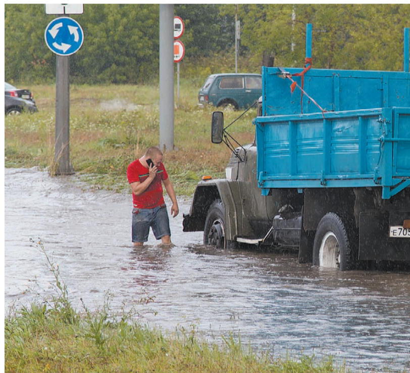
На круговом движении Серова - Циолковского-Первомайской.