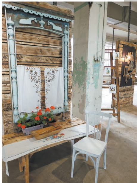
Инсталляция с наличником.

А в большом зале гулко звучат ударные и струнные «Сербряных струн», возвещая о торжественном открытии фестиваля.