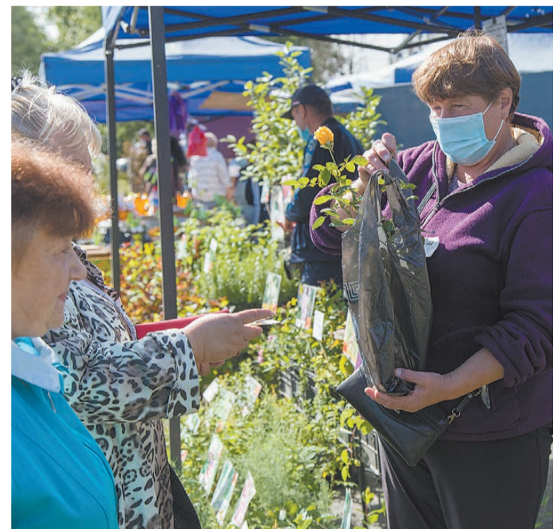
Идет бойкая торговля.