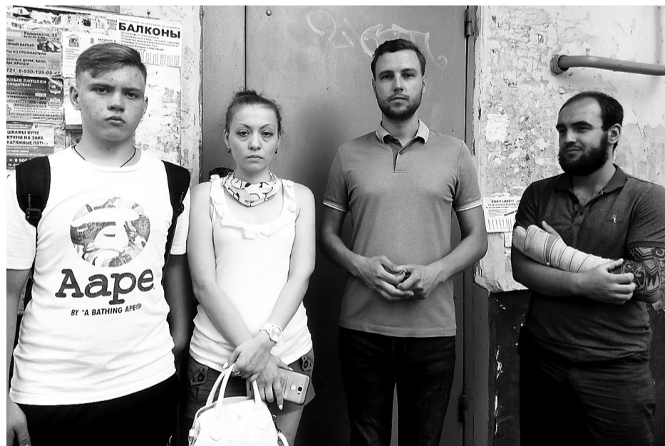
Жители квартир, оставшиеся без газа с 25 марта, вышли сообщить о своих проблемах корреспонденту «ТР».