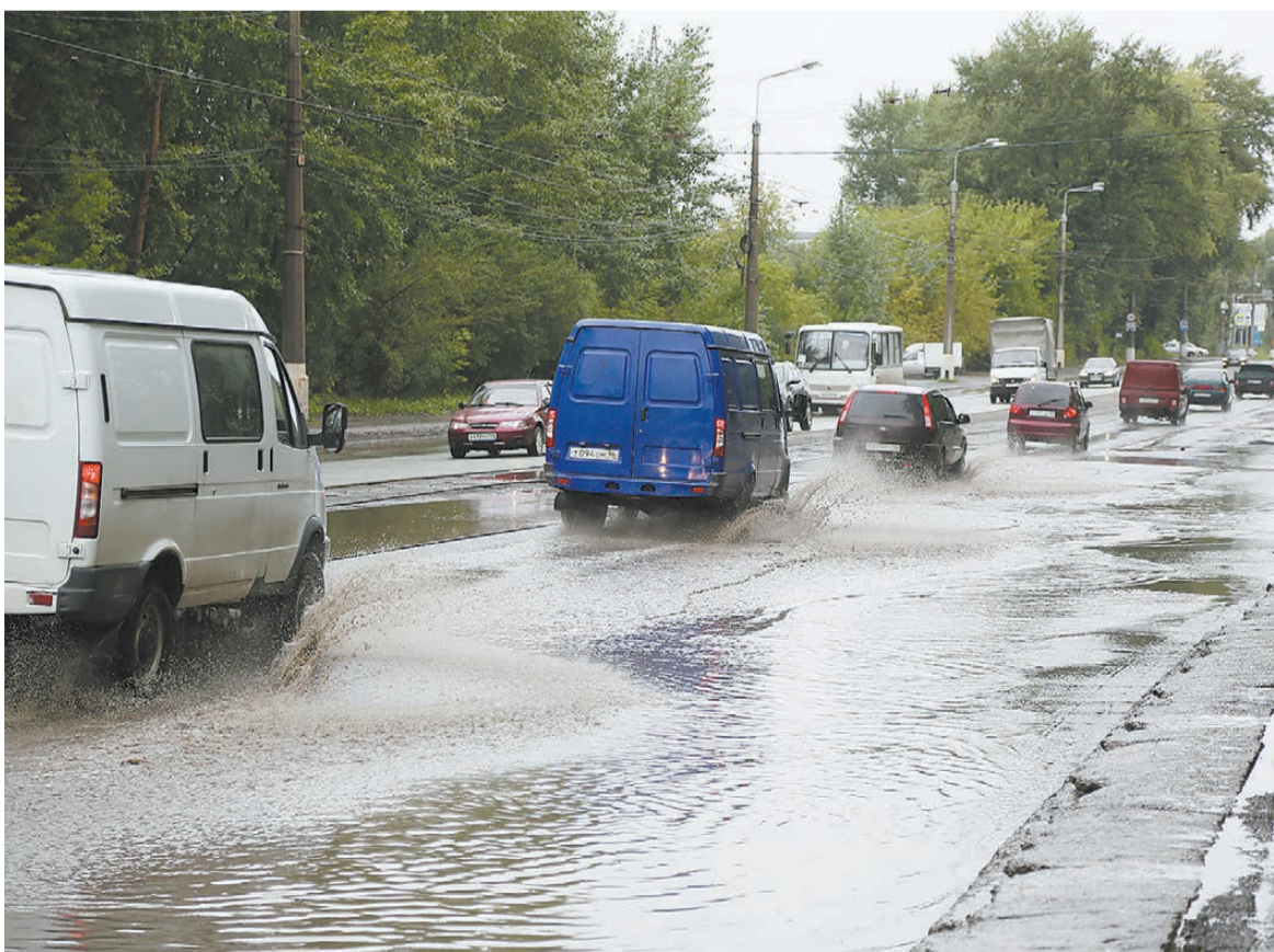
Улица Индустриальная. Надо усилить основание дороги.

- Наши специалисты во время сильных или продолжительных ливней объезжают улицы, проверяют, чтобы колодцы работали, очищают, если они забились мусором. На проспекте Строителей сделаны колодцы с плавающими люками, их достаточно бывает поднять, пошевелить, и вода уходит. Все-таки в конце июля и в августе осадки были на редкость интенсивные, да и ливневая канализация есть далеко не везде.