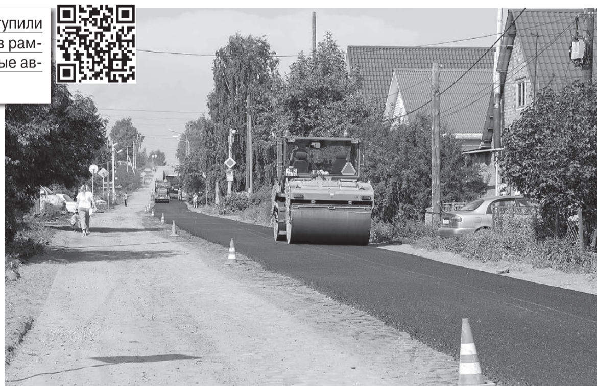
На Заречной укладывают асфальт.

На улице Дружинина в Гальяно-Горбуновском массиве работы подходят к завершению. Подрядчик уложил дорожное полотно, практически закончил асфальтирование парковок и остановок. Напомним, общественный транспорт ходит здесь всего несколько месяцев,