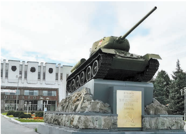
Танк Т-34 у проходной Уралвагонзавода.

Нижний Тагил получил почетное звание «Город трудовой доблести». Тагильчане этим гордятся, знают, какой огромный вклад в Победу в Великой Отечественной войне внесли наши предприятия, работавшие с 1941-го по 1945 год под девизом: «Все для фронта! Все для Победы!»