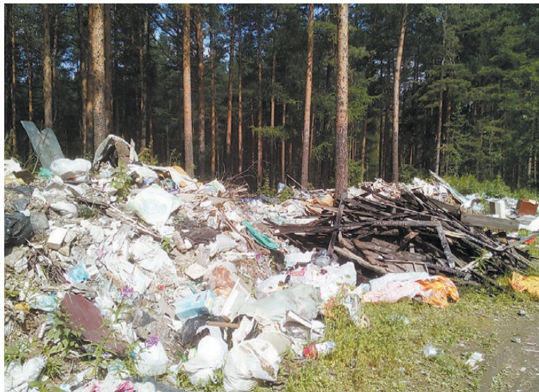
Свалка в лесу.