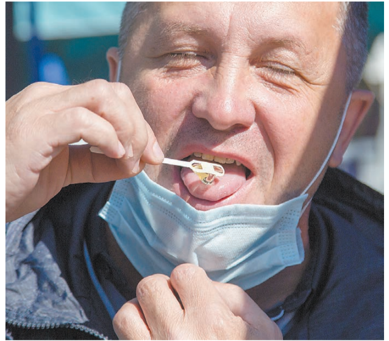
Самая приятная дегустация.