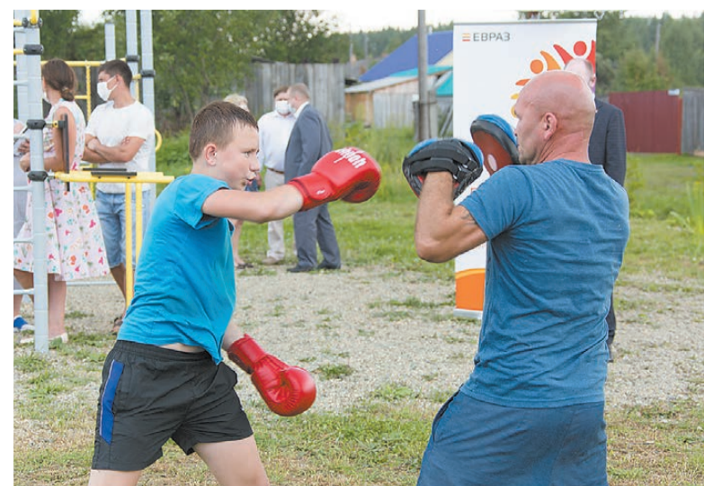
Спарринг с тренером.