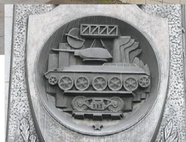
Один из барельефов на стене музея бронетанковой техники.

У многих тагильчан с этими домами и улицами связаны свои воспоминания. Мы предлагаем нашим читателям вместе составить маршрут памяти и трудовой доблести. О чем вы хотели бы рассказать в пер-