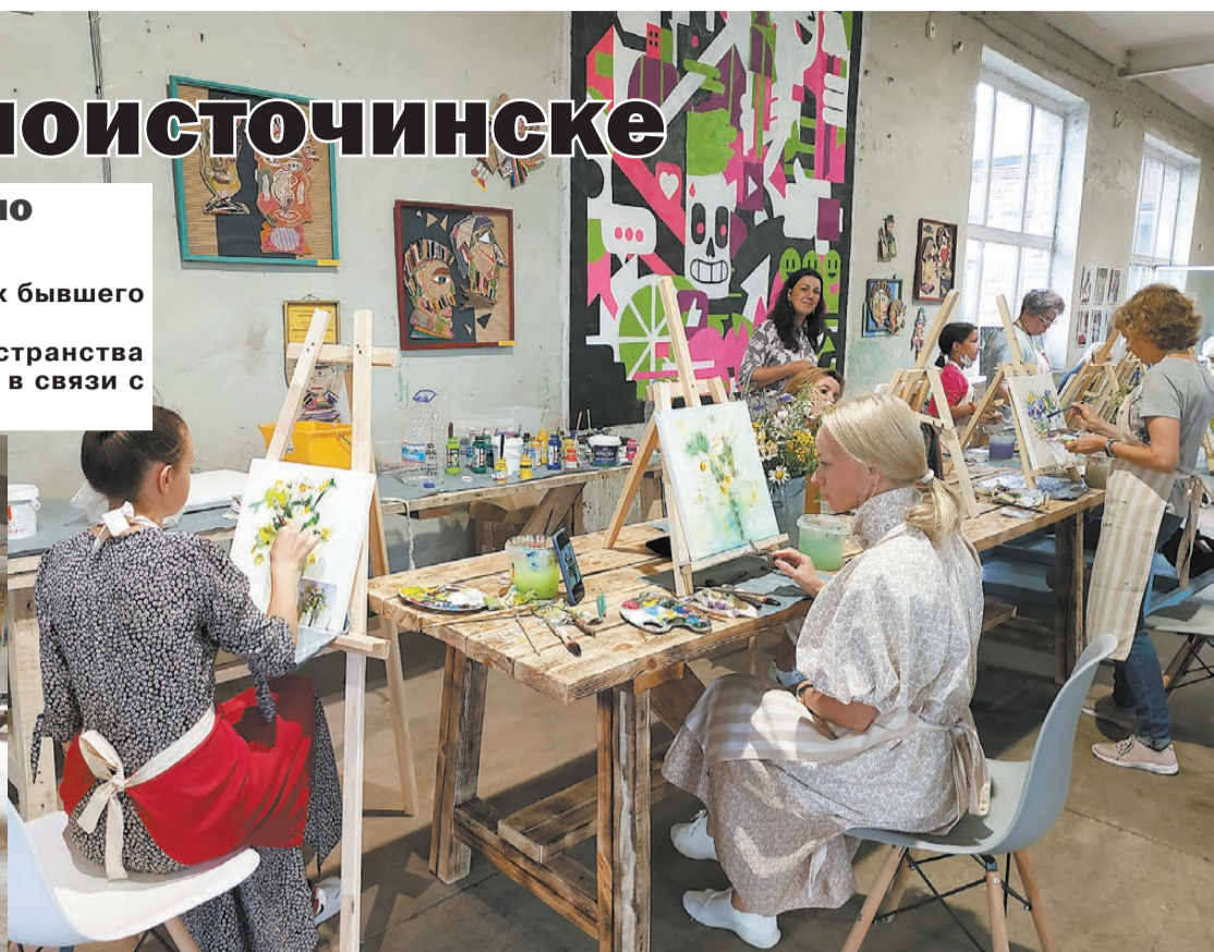
Мастер-класс по живописи с соблюдением дистанции.