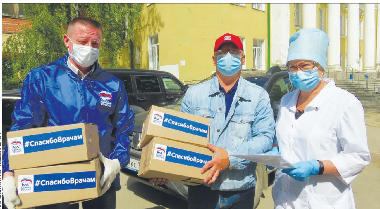
Первоуральские партийцы одними из первых в регионе подключились к волонтерской работе