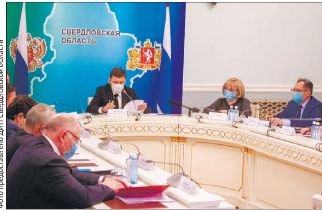
Евгений Куйвашев: «Сейчас необходимо предусмотреть возможные сценарии развития событий»

В минувший понедельник губернатор Свердловской области Евгений Куйвашев вновь подписал указ о продлении ограничительных мер, на этот раз – до 1 июня. На территории региона сохраняются масочный режим, а также требования по обязательной самоизоляции для людей старше 65 лет. Такое решение глава региона объяснил ростом коэффициента распространения инфекции.