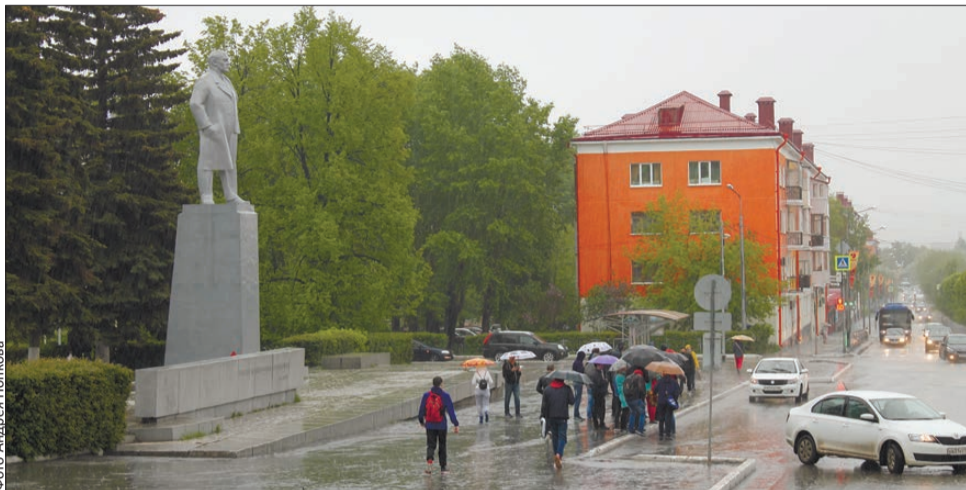
Ураган 25 мая в Первоуральске начинался с легкого дождя

Первоуральску в этом смысле, можно сказать, повезло. По крайней мере, нет человеческих жертв. Основной удар пришелся на систему электроснабжения. Без света остались 6 тысяч жителей городского округа, пострадали микрорайоны Динас, Талица, Пильная, поселок Билимбае, а также несколько улиц в центре города. Последствия урагана устраняли шесть бригад энергетиков, работы длились 8 часов, электроснабжение было полностью восстановлено к полуночи.