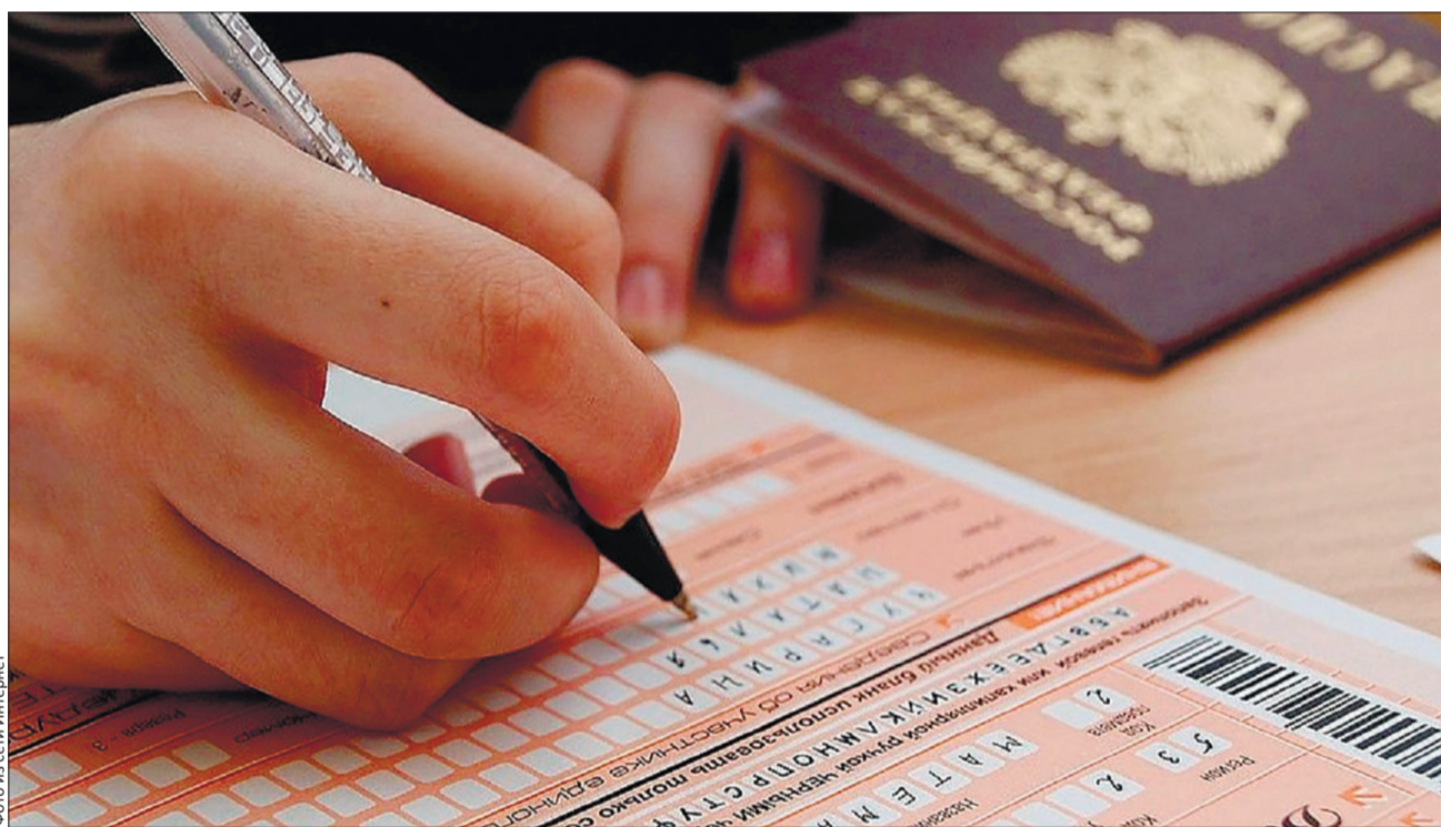
На поступление в вузы изменения не повлияют: абитуриенты смогут начать обучение как обычно – осенью

– Подчеркну, ЕГЭ будут сдавать только те выпускники, которые собираются поступать в вузы в текущем году. Что же касается аттестатов, то они будут выданы всем выпускникам без экзаменов. Такое решение является исключением, носит временный характер, – подчеркнул Владимир Владимирович. – Подать документы по результатам ЕГЭ можно сразу в несколько вузов, причем без личного присутствия. Что же касается особо важно для людей – зачисление пройдет в августе. Кроме того, для выпускников школ, которые по весовым причинам не смогут сдать ЕГЭ в июне, в августе можно будет